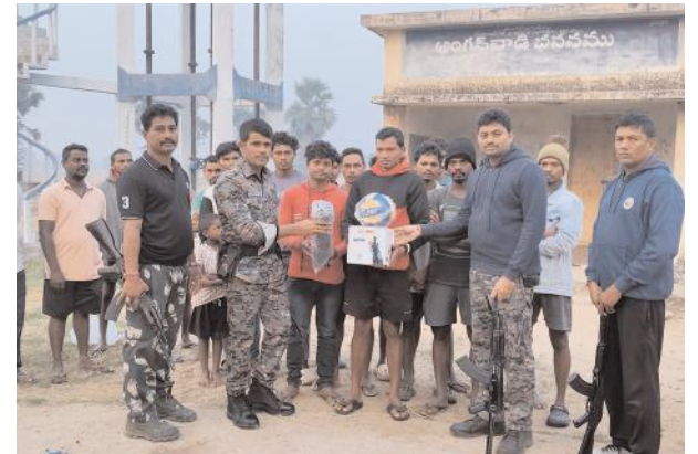
సిఆర్పిఎఫ్ సిబ్బంది పాల్గొన్నారు.