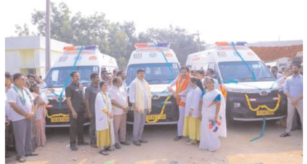
చేయడం జరిగిందన్నారు. మునుపెన్నడు లేనివిధంగా జిల్లాను అభివృద్ధి చేస్తున్నామన్నారు.

పిల్లలతో కలిసి భోజనం చేసిన మంత్రి మరిపెడ తెలంగాణ సాంఘిక సంక్షేమ శాఖ గురుకుల పాఠశాల కాలేజీలలో కామన్ డైట్ మెనూ ప్రారంభించి విద్యార్థులతో కలిసి భోజనం చేసి సరదాగా మాట్లాడుతూ అందుతున్న సౌకర్యాలు గురించి వివరాలు అడిగి తెలుసుకున్నారు. టీజీ డబ్ల్యూ ఆర్ ఈఎస్ పాఠశాలకు సందర్శించి పిల్లలతో ముచ్చటింది, అందుతున్న సేవలను వివరాలు అడిగి తెలుసుకున్నారు. క్షేత్రస్థాయిలో ప్రతి ఒక్కరికి విద్యా ఆరోగ్య పరిశుభ్రత పరిరక్షణ కోసం రాష్ట్రప్రభుత్వం ప్రత్యేకంగా చర్యలు తీసుకొని ఆరోగ్య, విద్యా తెలంగాణగా రూపొందించడం కోసం చర్యలు తీసుకుంటున్నామన్నారు. ట్రిబల్ వెల్ఫేర్ పాఠశాలలో విద్యార్థుల సమస్యలు విని వాటిని వెంటనే పరిష్కరించవలసిందిగా అధికారులను ఆదేశించారు.