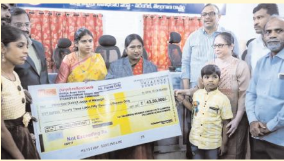
జాతీయ లోక్ అదాలత్ లో వరంగల్ లో 51 64, హనుమకొండలో 64 21 కేసుల పరిష్కారం