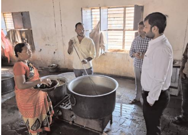
మాట్లాడుతూకొనుగోలు చేసిన ధాన్యాన్ని వెంట వెంటనే తరలించాలని ఎలాంటి ఇబ్బందులు లేకుండా కేంద్రాల నిర్వహించాలని అన్నారు ఇప్పటివరకు వచ్చిన ధాన్యం వివరాల రిజిస్టర్ లను తనిఖీ చేశారు. ధాన్యానికి సంబంధించి వివరాలను ఆన్లైన్లో నమోదు చేసి డబ్బులు త్వరగా పడే విధంగా చర్యలు తీసుకోవాలని అన్నారు, ఆశ్రమ హై స్కూల్, టీటీడబ్ల్యూ ఆర్ఎస్సెసి లలో మధ్యాహ్న భోజనం తనిఖీ, పరిసరాలను పరిశీలించారు, ప్రభుత్వం అత్యంత ప్రతిష్టాత్మకంగా చేపట్టిన డైట్ మెనూ షెడ్యూల్ మెనూ ప్రకారం రుచికరమైన భోజనం అందించాలని, వసతి గృహంలో పరిసరాలను ఎప్పటికప్పుడు సానిటేషన్ చేపించాలని స్టడీ రూమ్, మరుగుదొడ్లు, క్లాస్ రూమ్స్ పరిశుభ్రంగా ఉంచుకోవాలని అన్నారు, విద్యార్థిని విద్యార్థుల యొక్క మానసిక, విద్య, వైద్యం స్థితిగతులను గమనిస్తూ ఉండాలని, వంద శాతం ఫలితాలు వచ్చే విధంగా ప్రణాళిక ప్రకారం విద్యా బోధనలు అందించాలని ఉపాధ్యాయులను ఆదేశించారు, ఈ కార్యక్రమంలో సంబంధిత అధికారులు పాల్గొన్నారు.