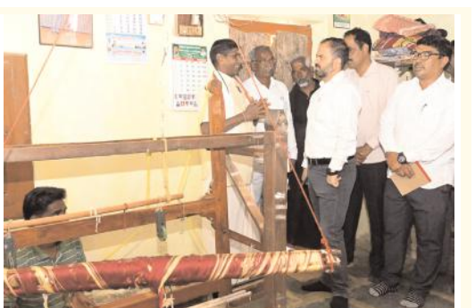
టస్సార్ వస్త్రాల మార్కెటింగ్ కొరకు