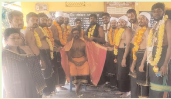
అయ్యప్ప స్వాముల దీక్ష ఇరుముడి