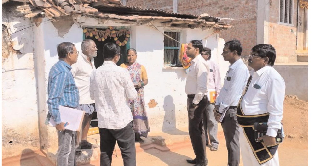
బతుకమ్మ కుంట అభివృద్ధి పనులకు ప్రతిపాదనలు అందజేయండి నర్సరీ ఆకస్మిక తనిఖీ