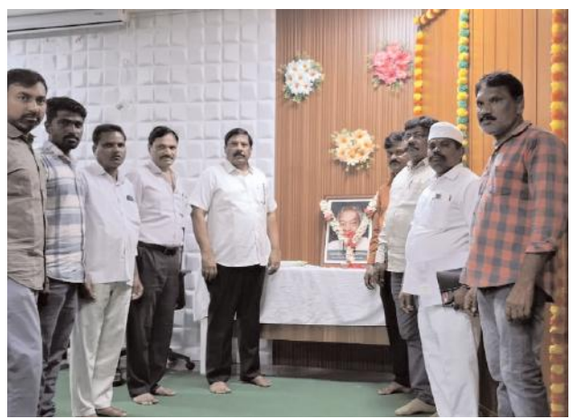
నడుస్తూ, ఆయన ఆశయాల సాధనకు కృషి చేయాలని పిలుపునిచ్చారు. ఈ కార్యక్రమంలో వివిధ శాఖల అధికారులు తదితరులు పాల్గొన్నారు.