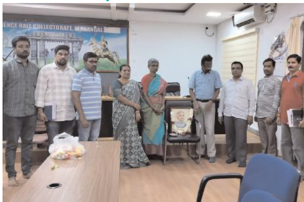
పిలుపునిచ్చారు.ఈ వర్ధంతి కార్యక్రమంలో వివిధ శాఖల సిబ్బంది తదితరులు పాల్గొన్నారు.