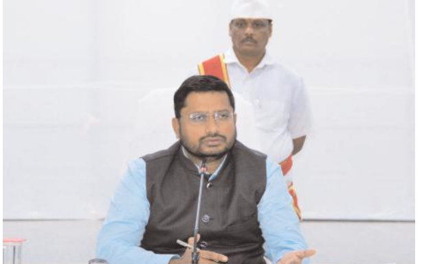
ప్రత్యేక అధికారులను నియమించిన కలెక్టర్....

బ్యాలెట్ పేపర్ ముద్రణకు తగిన ఏర్పాట్లు ఎన్నిక ప్రక్రియకు కీలకమైన బ్యాలెట్ పేపర్ ప్రింటింగ్ చేయడానికి అధికారులు చర్యలు తీసుకుంటున్నారు. ఇప్పటికే జిల్లాకు ఎన్నికల సామగ్రి 50శాతానికి పైగా చేరింది. అందులో ప్రిసైడింగ్, రిటర్నింగ్ అధికారులకు సంబంధించిన అంశాలతో ఉన్న ప్రింటింగ్ పేపర్లు వచ్చాయి. త్వరలోనే అధికారులకు ఎన్నికల నిర్వహణపై శిక్షణ ఇవ్వనున్నారు.