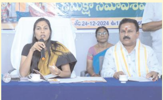
కొత్తకొండ జాతర ఏర్పాట్లు పూర్తి చేయాలి