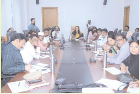
సీఎం కవ్ క్రీడల నిర్వహణకు