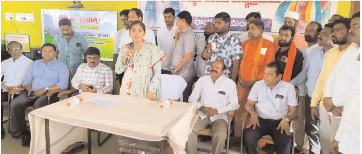
ప్రకారం హామీలను నెరవేర్చడంలో ముఖ్యమంత్రి కృషి చేస్తున్నారన్నారు రాష్ట్రంలో పేద బడుగు బలహీన వర్గాల అభివృద్ధి లక్ష్యంగా కాంగ్రెస్ ప్రభుత్వం పని చేస్తుందన్నారు రాష్ట్రంలోని అన్ని వర్గాల ప్రజలకు సమచిత