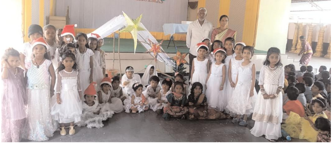
ఆటపాటలతో అలరించిన చిన్నారులు

కేక్ కట్ చేసి స్వీట్లు పంపిణీ చేసుకుని సంబరాలు