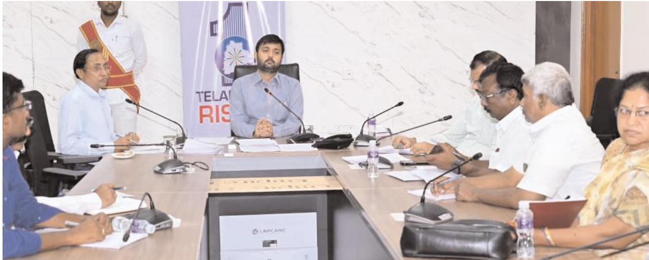
ఇందిరమ్మ ఇండ్ల సర్వే మొబైల్ యాప్ ద్వారా వివరాలు నమోదు చేయాలి