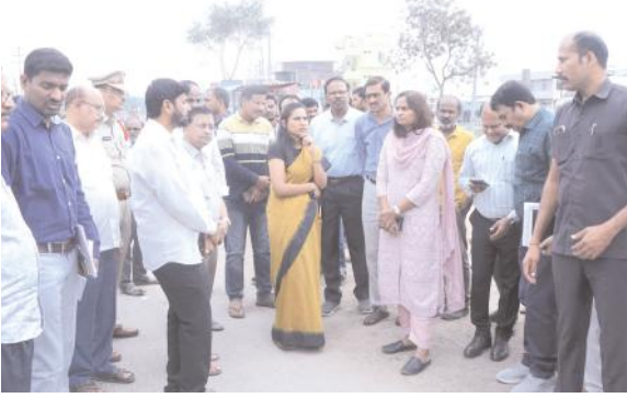
ఎల్కత్తుర్తి జంక్షన్ సుందరీకరణ పనులు