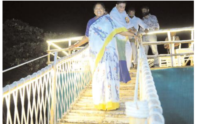
వివిధ శాఖల అధికారులు కాంగ్రెస్ పార్టీ జిల్లా బ్లాక్ మండల గ్రామ నాయకులు కార్యకర్తలు తదితరులు పాల్గొన్నారు.

ములుగు జిల్లా లో అనేకమైన టూరిజం ను అభివృద్ధి చేసి చూపిస్తామని ఇప్పటికే మా ములుగు జిల్లా లో లక్ష్మవరం,రామప్ప,బొగత జలపాతం,లక్ష్మీనరసింహ స్వామి దేవాలయం,అదివాసీల జాతర మేడారం లాంటి అనేక ప్రాంతాలు ఉన్నాయని ప్రకృతిని ఆస్వాదిస్తూ పర్యాటకులకు ఆహ్లాదం కలిగించే విధంగా మా ములుగు జిల్లా టూరిజం హబ్ గా ఉండటం మాకు గర్వకారణమని మేము కూడా ఇలాంటి స్పట్లను గుర్తించి పర్యాటకులకు అందుబాటులోకి తీసుకురావాలనే సంకల్పం తో మా జిల్లా కలెక్టర్, డిఎఫ్ఓ ఇతర శాఖల అధికారులు పని చేస్తున్నారని వారిని ఈ సందర్భంగా అభినందిస్తూ ఈ జిల్లా ను అన్ని విధాలుగా అభివృద్ధి చేసే భాధ్యత మన అందరిపైనా ఉందని మంత్రి అన్నారు.ఈ కార్యక్రమంలో