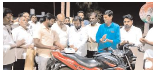
ఘనంగా రేగొండ ప్రెస్ క్లబ్ అధ్యక్షుడు జన్మదిన వేడుకలు