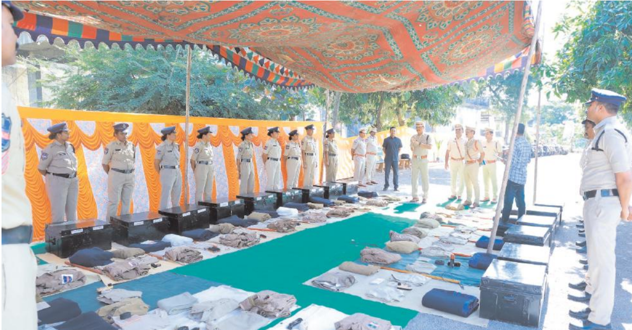
ఫిర్యాదుదారులకు త్వరగా న్యాయం చేకూర్చాలి