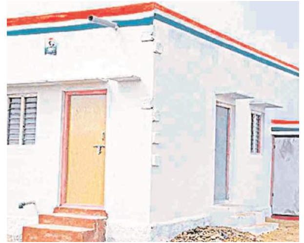
బాధ్యతల్ని ఈ శాఖ కు అప్పగించనుంది. ఇప్పటికే పలు జిల్లాలో డిఈలు, ఏఈలు విధుల్లో చేరాలని ఆదేశాలు జారీ.

గత ప్రభుత్వం హాసింగ్ శాఖ లో పని చేసే అధికారులు, సిబ్బంది మున్సిపల్ , పంచాయతీరాజ్ తదితర శాఖ లకు కేటాయించింది. సిబ్బంది కేటాయింపులతో జిల్లా కు ఒకరు లేదా ఇద్దరు మాత్రమే మిగిలారు. ప్రతి జిల్లాలో డిఈ స్థాయి అధికారి మాత్రమే ఉండగా కొన్ని చోట్ల ఒకరిద్దరు సిబ్బంది ఉన్నారు. గత ప్రభుత్వం చేపట్టిన డబుల్ బెడ్ రూమ్ ఇండ్ల నిర్మాణ బాధ్యతల్ని ఇతర ఇంజనీరింగ్ శాఖ లకు అప్పగించింది. ఒక్కో జిల్లాలో ఒక్కో శాఖ కు ఇచ్చారు. పంచాయతీ రాజ్, ఆర్ అండ్ బీ, సోషల్ వెల్ఫేర్ వంటి ఇంజనీరింగ్ విభాగాలు డబుల్ బెడ్ రూం ఇండ్ల నిర్మాణాలను పర్యవేక్షించేవి. నోడల్ ఆఫీసుగా హాసింగ్ శాఖ ను ఉంచి నిర్మాణ ప్రక్రియ పూర్తి గా ఆయా ఇంజనీరింగ్ విభాగాలు చేపట్టాయి. మిగిలిన ఒకరిద్దరు అధికారులు, సిబ్బంది నోడల్ ఏజెన్సీ ఆఫీసులో ఉంటూ నిర్మాణ పక్రియను మానిటరింగ్ చేసేవారు. అయితే కాంగ్రెస్ ప్రజా ప్రభుత్వం హాసింగ్ శాఖ నుంచి ఇతర శాఖలకు వెళ్లిన సిబ్బంది ని తిరిగి తమ సొంత శాఖకు రప్పిస్తుంది. ప్రభుత్వం ఇండ్ల నిర్మాణ