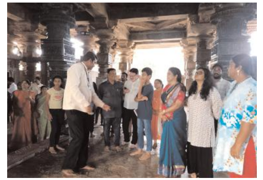
రామప్పను సందర్శించిన బీహార్ అడిషనల్ చీఫ్ సెక్రటరీ