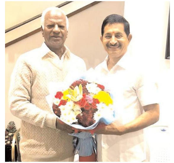
వేం నరేందర్ రెడ్డి కి