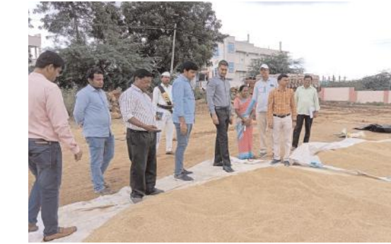
ధాన్యం కొనుగోళ్లను సక్రమంగా నిర్వహించాలి