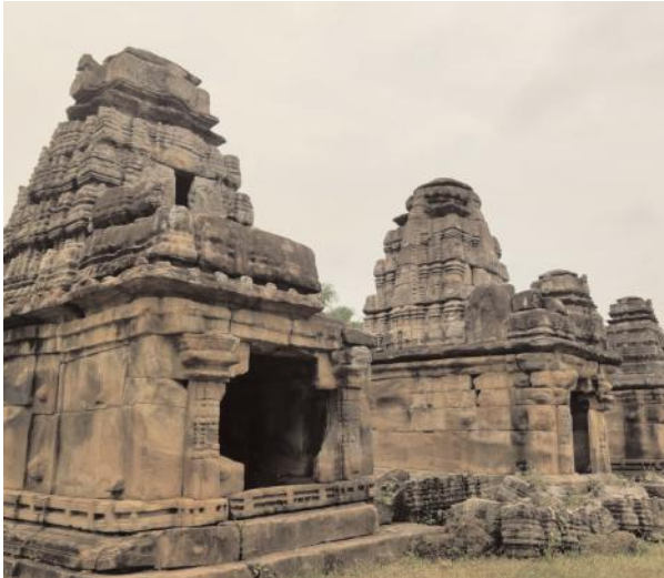
టూరిజం హబ్ లో స్థానం దక్కించుకున్న కోట గుళ్ళు

రామప్ప కోటగుళ్ళు రెండు ఆలయాలను కాకతీయులు నిర్మించినప్పటికీ రామప్ప కు మాత్రం ప్రపంచ పరంలో స్థానం దక్కింది శిథిలావస్థకు చేరిన కోటగుళ్ళు నిరాధారణకు గురికాగా 18 సంవత్సరాల క్రితం కోట గుళ్ళు పరిరక్షణ కమిటీ ఏర్పాటు చేసి దాతల సహకారంతో ఆలయాన్ని అంచెలం చెలుగా అభివృద్ధి చేశారు. ఆలయ ప్రాంగణంలో గోశాలను నిర్మించారు. ప్రతి సంవత్సరం మహాశివరాత్రి, కార్తీక షాక్రమి వేడుకలు ఇక్కడ ఘనంగా జరుగుతాయి. ఆలయాన్ని సందర్శించేందుకు పర్యటకులు భక్తులు పెద్ద సంఖ్యలో తరలివస్తున్నారు రామప్ప దేవాలయాన్ని ప్రపంచ వారసత్వ సంపదగా గుర్తించిన కేంద్ర ప్రభుత్వం రామప్ప కు కేవలం 9 కిలోమీటర్ల దూరంలో ఉన్న కోటగుళ్ళ అభివృద్ధికి నడుం బిగించింది. కోట గుళ్ళు గణప సముద్రం సరస్సు అభివృద్ధికి కేంద్ర ప్రభుత్వం నిధులు కేటాయించడం ఇదే మొదటిసారి. గతంలో అప్పటి ఉమ్మడి రాష్ట్ర ప్రభుత్వం రెండు కోట్లు కేటాయింది కొంత పనులు మాత్రమే పూర్తి చేసింది.