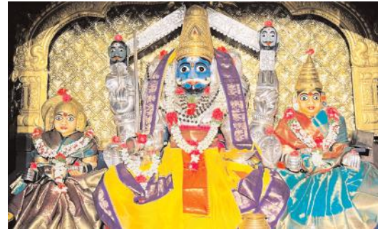
ఐలోని మల్లన్న ను దర్శించుకున్న బాల బ్రహ్మానంద సరస్వతి