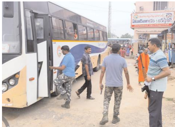
వారం సివిల్. సిఆర్పిఎఫ్. ప్రత్యేక బలగాలతో పోలీసుల విస్తృత తనిఖీలు.