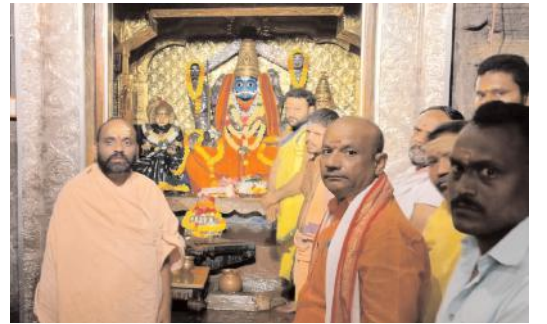
ఐనవోలు మేజర్ న్యూస్ సూర్య డిసెంబర్ (8) హనుమకొండ జిల్లా అయినవోలు మండల కేంద్రంలోని ప్రసిద్ధిగాంచిన శైవ క్షేత్రం శ్రీ భ్రమరాంబ సమేత మల్లికార్జున స్వామి దేవస్థానంలో నైమి