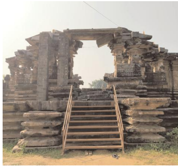
కోట గుళ్ళ లో సాస్కీ స్కీమ్ లో చేయనున్న పనులు ఇవే..

కేంద్ర రాష్ట్ర ప్రభుత్వాలు గుర్తించక మరుగునపడి శిథిలావస్థకు చేరుకున్న కోట గుళ్ళు ఆలయం నేడు కేంద్ర ప్రభుత్వం సాస్కీ పథకం లో రామప్ప తో పాటు అన్ని విధాల అభివృద్ధి చేసేందుకు రూ. 73.74 కోట్లు కేటాయించింది. దీంతో కేంద్ర పర్యాటక శాఖ నూతనంగా తయారు చేసే టూరిజం హబ్ లో కోట గుళ్ళ కు స్థానం దక్కింది.