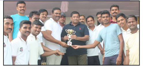
ఉల్లాసం కోసం క్రీడలను ఎంచుకోవాలని, అలల్లో గెలుపు ఓటములు సహజం అని, నిజ జీవితంలో కూడా వీటిని ప్రతి ఒక్కరు అలవర్చు కోవాలని తెలియజేశారు.

జిల్లా పోలీస్ ఏఆర్ హెడ్ క్వార్టర్స్ లో స్నేహపూర్వక వాతావరణంలో పోలీసులు డ్రైన్ మధ్య క్రికెట్ మ్యాచ్ ను నిర్వహించడం జరిగింది.