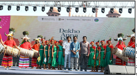
నిర్వహించిన జయతి జయ మామ భారతం కళాకారులు రావడం మాతో కలవడం

అనే కార్యక్రమంలో తెలంగాణ రాష్ట్రం తరపున మా బృందానికి అవకాశం రావడం అలాగే ప్రపంచ గిన్నీస్ రికార్డులో స్థానం