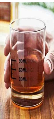
బెల్ట్ షాపుల్లో సిటింగ్ ఏర్పాటు చేస్తున్నా పట్టింబుకొనేవారు లేరు. ఆహార పదార్థాలు తయారు చేస్తూ