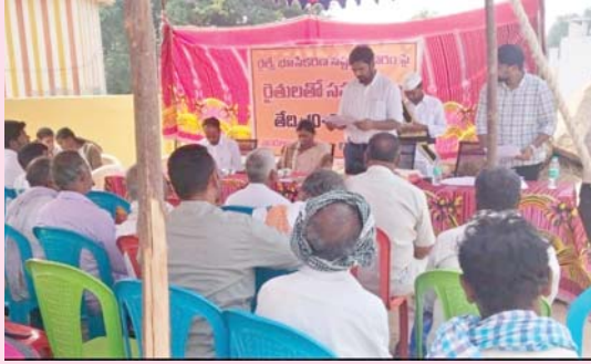
పాటు గ్రామ రైతులు పాల్గొన్నారు.