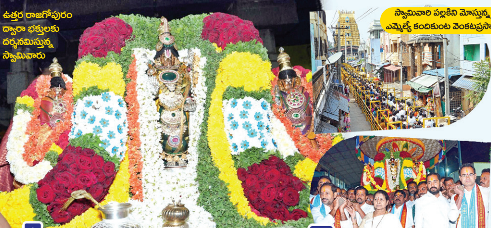
ఉత్తర రాజగోపురం ద్వారా భక్తులకు దర్శనమిస్తున్న స్వామివారు