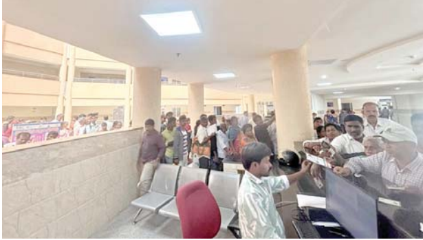
ఓపి అందకనే వెనుదిరిగిన రోగులు