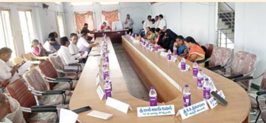
అజెండాలో పెట్టడం. పట్టించుకోదు. కాబట్టి అవిశ్వాసం పెట్టడానికి వెనకాడం.