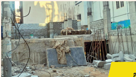
అదే కమలా నగర్లో దాని ఎదురుగా మరొకటి అనధికారిక సిల్లార్ తో అనధికారిక నిర్మాణం

► మొదటి పేజీ తరువాయి మరీ ముఖ్యంగా ఏ ఉన్నతాధికారి కూడా వారి జోలికి వెళ్ళరు. వారంతా బడా.. వారి జోలికి వెళ్ళే ఎవరికైనా ధడే అనేంత స్థాయిలో అనంతనగరంలో మితిమీరు తున్నాయట అక్రమ కట్టడాలు. ఆ పెద్దలకు అనుగుణం గానే అనంతనగరంలో వ్యవహారం నడుస్తూ ఉండడం మరో