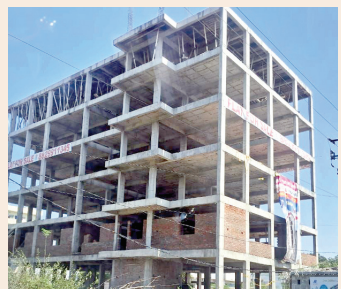
రాంగనర్ 80 ఫీట్ రోడ్డు నీరు ప్రగతి వనం ఎదురుగా అలాగే కొంచెం ముందుకు వెళ్ళే... నగరపాలక నిబంధనలకు విరుద్ధంగా, మరోవైపు నిర్మాణంలో ఉండగానే ప్లాట్లు సీల్ కు పెట్టిన దృక్పథం

పాపం ఇది తెలియని ఎందరో మీడియా మిత్రులు పత్రికల్లో ఆధారాలతో ఎన్ని కథనాలు రాసిన ఉన్నతంగా ఉన్నతాధికారులను ఇక్కడి ప్లానింగ్ అధికారులు బురిడీ కొట్టిస్తూ ఫలితం లేకుండా చేస్తున్నారనే తెలిసింది.