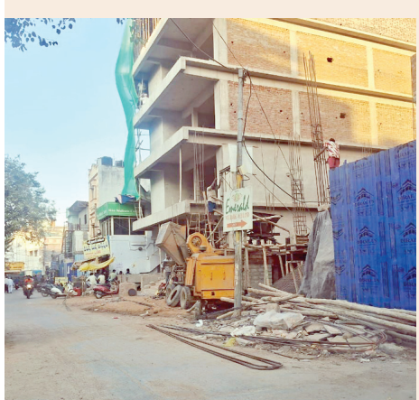
ఓ మహిళా బజెసి నాయకురాలు పేరుతో...అనంతపురం కమలానగర్ లో ఎమరాల్డ్ హిల్స్ పక్కనే అనధికారిక సిల్లార్ తో అనధికారిక నిర్మాణం