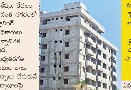
ఈ కనిపిస్తున్న బహుళ భవంతి పూర్తిగా అనధికారికం, ఎలాంటి నగరపాలక అనుమతులు తీసుకోకుండా రూ. లక్షల్లో పన్నుకు పంగనామం పట్టి ఇలా..ఇది ఓ మాజీ సీటి కేబుల్ నిర్మాకుడిది అని తెలిసింది, దీని వెనక ఓ మాజీ ఎమ్మెల్యే హస్తము ఉన్నట్లు సమాచారం.

ఎవరైనా ఉన్నత అధికారు లు నిజాయితీగా చర్యలు తీసుకుందామని ఒక అడుగు ముందుకు వేస్తే అనంతలోని ఓ ప్లానింగ్ అధికారిణి తాను నిజాయితీగా పనిచేస్తున్నారని ద్రామాలాడేలా మొదట నోటీసు పంపించి, తర్వాత ఉన్నతంగా ఉన్నత అధికారులు అందిస్తుంది. అప్పటికి నిర్మాణాలు సాగుతూనే ఉంటాయి అయినా మళ్ళీ పొరపాటున ఎవరైనా ఉన్నతాధికారి