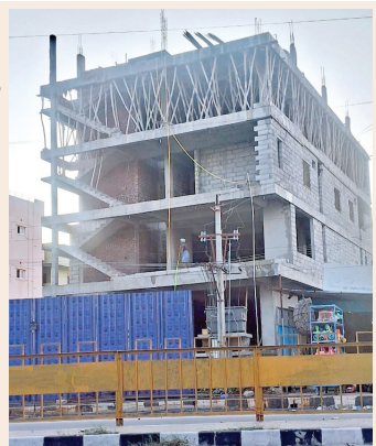
అదే ఆర్టిటి ఎదురుగా మరొక పోస్టిటల్ నగరపాలక నిబంధనలకు విరుద్ధంగా అనధికారిక నిర్మాణం

అనంతపురం నగరంలో చాలావరకు అనధికారి నిర్మాణాలు వెలుస్తున్నాయి. నూటికి 99 అనధికారిక సిల్లార్లతో, నూటికి 99 సెట్ బ్యాక్స్ ఫుల్ డివియేషన్తో, ఒకలా అనుమతి తీసుకొని మరొకలా సాగే నిర్మాణాలు, రెసిడెన్షియల్ అనుమతి తీసుకొని కమర్షియల్ సాగే నిర్మాణాలు, 14 శాతం పన్ను లేకుండా అనుమతులు, డీ మూడ్ అనుమతులు ( ఏమీ చేయకుండా రోజుల తరబడి మౌనంగా ఉంటే ఆ పైలు దానంతకు అదే అనుమతి పొందడం ), ప్రభుత్వ స్థలాల్లో నిర్మాణాలకు అనుమతులు , ప్రభుత్వ స్థలాల్లో జరిగే నిర్మాణాలను చూసి చూడనట్లు ఉంటే ఇంకో రకమైన వసూళ్లు ఇలా చెప్పుకుంటూ పోతే చాలానే విచ్చలవిడిగా ప్రభుత్వ ఖజానాకు చేరాల్సిన ఆదాయాన్ని పక్కదూరి పట్టిస్తూ సొంత ఖజానా నింపుకుంటున్నారని కొందరు అధికార పాలకులు. వాటి వివరాలను ఎంతో సాహసో పేతంగా "మేజర్ హ్యూస్ " అందరికీ అర్థమయ్యేలా ఆధారాలతో మరొకొన్ని కథనాలను ప్రచురించి వివరించే ప్రయత్నం చేస్తుంది.