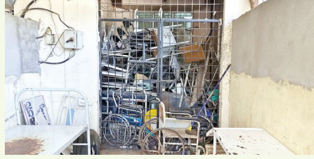
వడం దారుణం అంటూ విమర్శిస్తున్నారు.

ఇటు ప్రభుత్వ సర్వజన అనుపత్తి తో పాటుగా దాని అదం అనుబంధంగా కొనసాగుతున్న సూపర్ స్పెషాలిటీ అనుపత్తికి సంబంధించి ప్రధాన ఆదాయ వనరును పూర్తిగా అధికార యంత్రాంగం నిర్లక్ష్యం చేస్తుందని తీవ్రమైన విమర్శలు వెల్లువెత్తుతున్నాయి. ప్రధానంగా పార్కింగ్ వ్యవహారం దీనికి తోడు ప్రభుత్వ సర్వజన అనుపత్తి పరిధిలో ఉన్న అనేక వ్యాపార సముదాయాలు వాటికి రావాల్సిన నెలసరి అద్దెల వసూలు విషయంలో కనీసం చర్యలు కూడా తీసుకోవడం లేదంటూ విమర్శిస్తున్నారు. దీంతోపాటు ప్రభుత్వ సర్వజన అనుపత్తికి ఎలాంటి సంబంధం లేని ఇతర శాఖలకు సంబంధించిన కార్యాలయాలు అనుపత్తి ప్రాంగణంలో ఉన్నాయి వాటిపై ఎలాంటి ఆదాయ వనరును కూడా చేకూర్చుకోలేకపో