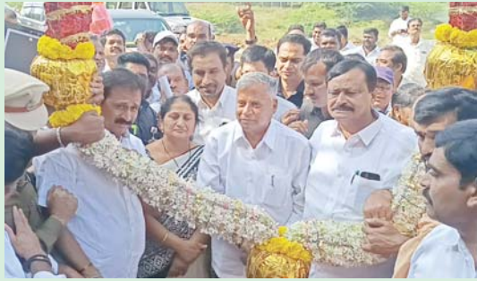
వ్యక్తపరిచారు. ఈ ప్రాంతంలో రైల్వే పనుల పునరుద్ధరణ తదితర విషయాలపై ఇక్కడ కావాల్సిన ఏర్పాట్లపై పూర్తిగా తెలియజేశారని వీటన్నిటిని పరిష్కారం వైపు కృషి చేస్తానని ఆయన తెలియజేశారు. ఈ కార్యక్రమంలో నాయకులు, కార్యకర్తలు, అభిమానులు, బిజెపి జనసేన కూటమి నాయకులు పెద్ద ఎత్తున పాల్గొన్నారు.