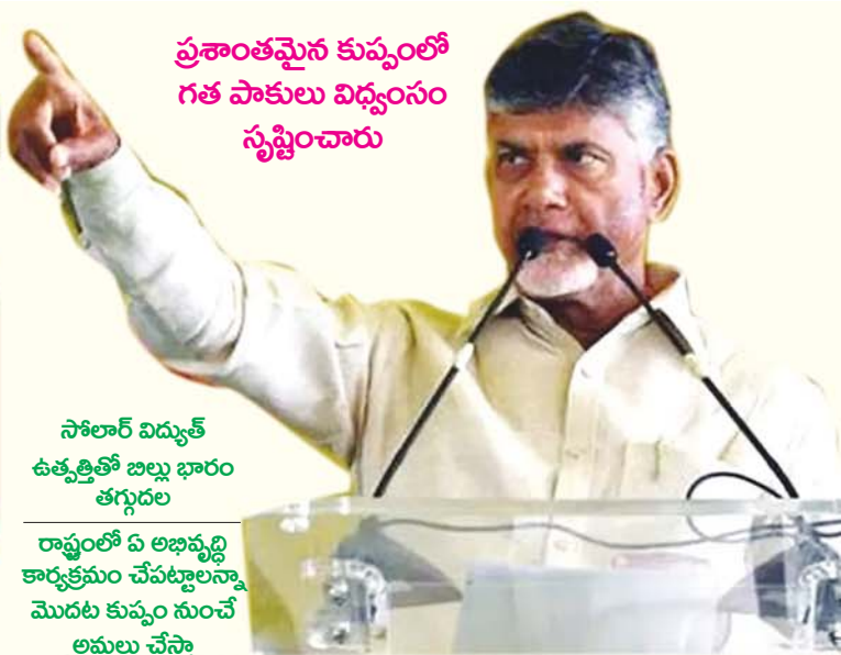
ప్రశాంతమైన కుప్పంలో గత పాకులు విధ్వంసం సృష్టించారు