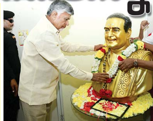
కుప్పం, మేజర్ న్యూస్: గత ఐదేళ్లలో ధ్వంసమైన వ్యవస్థలను గాడిలో పెడుతున్నానని, ఓట్లెసి గెలిపించిన ప్రజలకు న్యాయం చేయాల్సిన బాధ్యత తనపై ఉందని ముఖ్యమంత్రి చంద్రబాబు నాయుడు అన్నారు. ప్రజలందరికీ సుపరిపాలన

ప్రజలందరికీ న్యాయం చేయడం ముఖ్యమంత్రిగా నా బాధ్యత పాట్ల కోసం సేవ చేసిన వారికి నామినేటెడ్ పదవులతో న్యాయం చేస్తా ప్రజలకు సుపరిపాలన అందించడం కోసమే "జన నాయకుడు" పోర్టల్ మరో పాట్ల సింబల్ తెలియని నియోజకవర్గం కుప్పం మారుమూల ప్రాంతమైన కుప్పాన్ని దేశానికే ఆదర్శ నియోజకవర్గంగా తీర్చిదిద్దటా 2వ రోజు కుప్పం పర్యటనలో ముఖ్యమంత్రి చంద్రబాబు