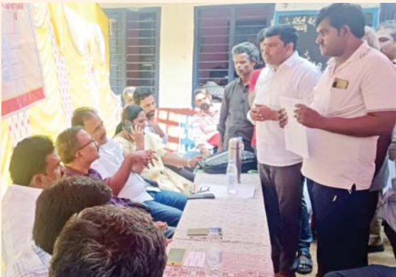
అధికారులు, పోలీసుల సమక్షంలోనే తప్పుడు ఫిర్యాదు చేసిన వారు వ్యక్తిగతంగా దూషించడం, దాడికి ప్రయత్నించడం జరిగిందని, ఎన్ని ఆటంకాలు సృష్టించినా శివాలయం నిర్మాణం పూర్తి చేసి తీరుతామని కమిటీ సభ్యులు స్పష్టం చేశారు. అడ్డుకోవాలని ప్రయత్నిస్తే హిందూ సంఘాలు ఏకమై ఉద్యమిస్తామని హెచ్చరించారు.

రామచంద్రపురం మేజర్ న్యూస్ : హిందూ దేవాలయ నిర్మాణం పై కక్క సాధించు ఎందుకని రామచంద్రపురం మండలం, అనుపల్లిలో జరిగిన రెవెన్యూ సదస్సులో అధికారులను జన్మస్థల శివాలయం కమిటీ సభ్యులు నిలదీశారు. రేకలచెను గ్రామంలో వెలసిన ఉన్న జన్మస్థల శివాలయం 200 ఏళ్లుగా నిత్యపూజలు అందుకుంటుంది. ఆలయం శిథిలావస్థకు చేరడంతో పక్కనే నూతన ఆలయాన్ని నిర్మాణం చేపట్టారు. అయితే భూ కట్టాకు పాల్పడుతున్నారని కొందరు గ్రామస్థులు ఫిర్యాదు చేయడం, ఎమ్మార్వో ఆదేశాలు ఇవ్వడంతో దాతల పై పోలీసులు ల్యాండ్ గ్రాబింగ్ కేసులు నమోదు చేశారని ట్రస్ట్ సభ్యులు ఆవేదన వ్యక్తం చేశారు. అలాగే చర్చిలు, మసీదులకు అనుమతులు ఉన్నాయా? అని ప్రశ్నించారు. అనుమతులు ఉంటేనే దేశ వ్యాప్తంగా దేవాలయాలు నిర్మించారా? అంటూ నిలదీశారు. దేవాలయాన్ని నిర్మిస్తున్న తమపై రెవెన్యూ