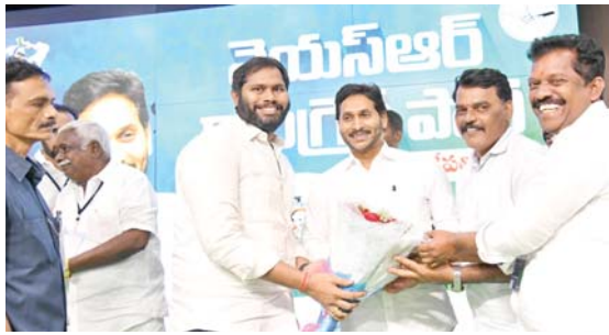
సిద్ధంగా ఉన్నామని అధిష్టానానికి తెలియ చేసినట్లు తెలుస్తోంది.