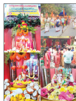
అందించాలని కోరారు. స్వయంగా గరికను సమర్పించడం ఉత్పన్న వైభవమని పీఠం తెలియజేసింది.