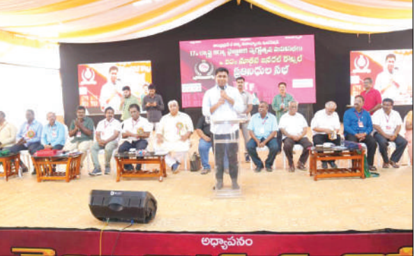
కోవడం చాలా సంతోషంగా ఉందని జిల్లా కలెక్టర్ తెలిపారు. ఈసమాజాన్ని ప్రభావితం చేసే వ్యక్తుల్లో ఉపాధ్యాయులు ఎప్పుడూ