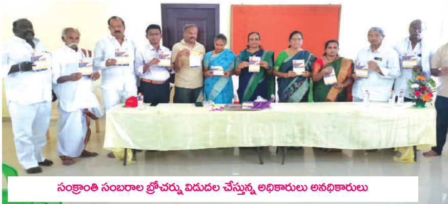
సంక్రాంతి సంబరాల బ్రోచర్ను విడుదల చేస్తున్న అధికారులు అనధికారులు

దుగ్గిరాల వన్ సేవా ట్రస్ట్ ఆధ్వర్యంలో నిర్వహిస్తున్న విద్యా, వైద్య, సామాజిక అభివృద్ధి, పర్యావరణ పరిరక్షణతో పాటు మన సంస్కృతి సాంప్రదాయ కళలను భావితరాలకు అందించే విధంగా. దోస్త్ ఆధ్వర్యంలో నిర్వహించే సంక్రాంతి సంబరాలను జయప్రదం చేయాలని జంపాల కాంప్లెక్స్ నందు బుధవారం బ్రోచర్ను ఆవిష్కరించారు. దోస్త్ ఆధ్వర్యంలో ఈ నెల 12, 13 తేదీల్లో సంక్రాంతి సంబరాలు నిర్వహిస్తున్నారని , అందరూ జయప్రదం చేయాలని బ్రోచరావిష్కరణలో పాల్గొన్న పలువురు కోరారు. సంక్రాంతి సంబరాలు సందర్భంగా తొలిరోజు 12న పాఠశాల విద్యార్థులచే వాలీబాల్, కబడ్డీ క్రికెట్ ,చిత్రలేఖనం. క్విజ్ పోటీలు నిర్వహించనున్నారని 13న భోగి మంటలు కోలాటాలు, సాంస్కృతిక కార్యక్రమాలు, హరిదాస కీర్తనలు, మేళతాళాలతో రెండు కిలోమీటర్ల నడక ర్యాలీ, గంగిరెద్దులాటలు తో పాటు మహిళా మణులకు మండల స్థాయిలో ముగ్గుల పోటీలు నిర్వహించ నున్నట్లు నిర్వాహకులు తెలిపారు. మహిళలకు రంగవల్లుల