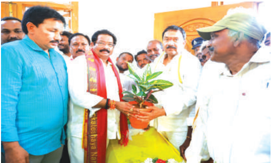
వినుకొండ, మేజర్ న్యూస్:

వినుకొండ నియోజకవర్గ చీఫ్ విప్ జీవీ నివాసంలో ఘనంగా నూతన సంవత్సర వేడుకలు