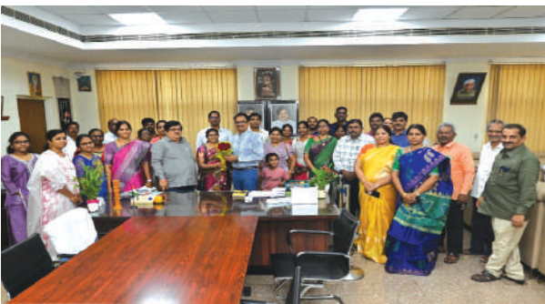
ఏ ఎన్ యు/ పెదకాకాని, మేజర్ న్యూస్:-