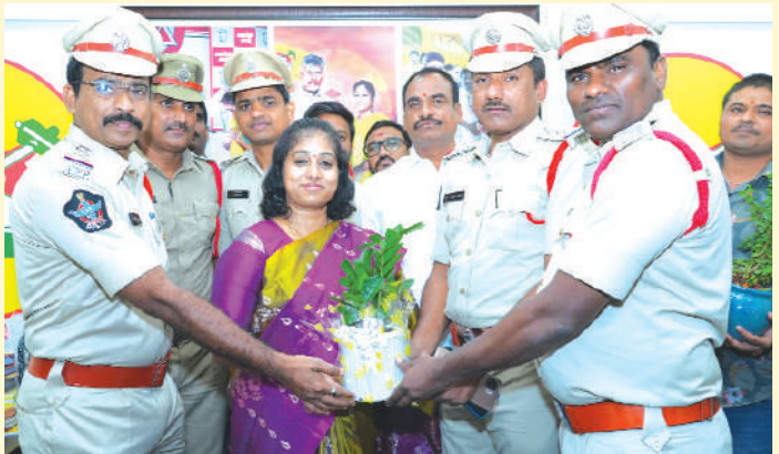
గుంటూరు క్రైమ్ మేజర్ న్యూస్ :