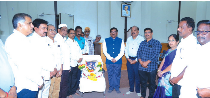
గుంటూరు నగర పాలక సంస్థ, మేజర్ స్టూన్స్ :