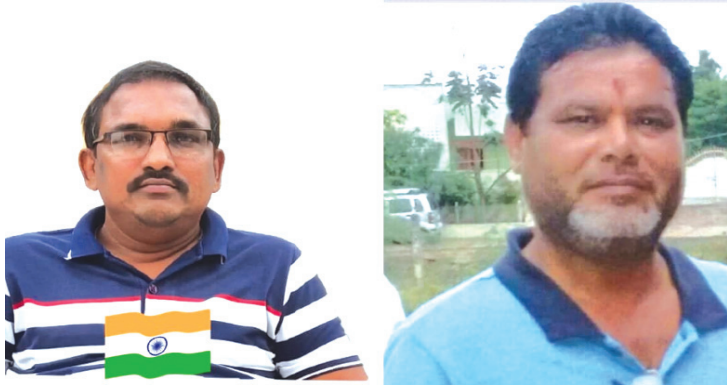
మంగళగిరి టౌన్, మేజర్ న్యూస్: