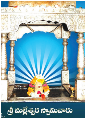
శ్రీ మల్లేశ్వర స్వామివారు