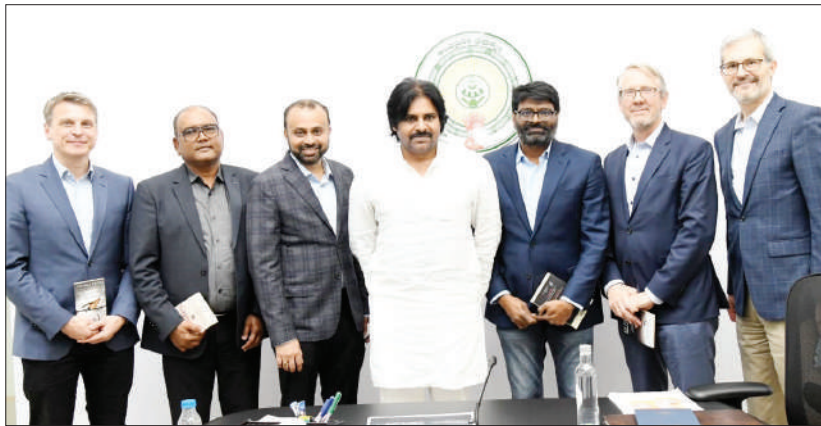
ప్రాంతలాంటివి ఇందులో ఉంటాయి. దేశంలో ఇదే తొలి ప్రైవేట్ ఈ.వి. పార్కు దీని ద్వారా రూ.13 వేల కోట్ల పెట్టుబడులు వస్తాయనీ, 25 వేల మందికి ఉద్యోగ ఉపాధి అవకాశాలు లభిస్తాయనీ వివరించారు. పవన్ కళ్యాణ్ స్పందిస్తూ 'కర్నూలు జిల్లా ఓర్వకల్లు దగ్గర ఎలక్ట్రిక్ వెహికిల్ పార్క్ ఏర్పాటు కానుండటం ఆహ్లానించదగ్గ పరిణామం. రాష్ట్ర

గుంటూరు, మేజర్ స్టాప్ : కర్నూలు జిల్లా ఓర్వకల్లులో ఎలక్ట్రిక్ వెహికిల్ పార్క్ ఏర్పాటు 'పర్యావరణహితమైన వాహనాల వినియోగం పెరగాల్సిన అవసరం ఎంతైనా ఉంది. కాలుష్యాన్ని గణనీయంగా తగ్గించడంపై గౌరవ ప్రధానమంత్రి సరేంద్ర మోదీ గారు ప్రత్యేక దృష్టిపెట్టారు. ఇందులో భాగంగా ఎలక్ట్రిక్ వాహనాలు విరివిగా అందుబాటులోకి రావాలి' అని రాష్ట్ర ఉప ముఖ్యమంత్రి, అటవీ పర్యావరణ శాఖ మంత్రి పవన్ కళ్యాణ్ తెలిపారు. శుక్రవారం సాయంత్రం మంగళగిరిలోని క్యాంపు కార్యాలయంలో పీపుల్ టెక్ ఎంటర్ ప్రైజెస్ సంస్థ ప్రతినిధులు ఉప ముఖ్యమంత్రివర్యులతో భేటీ అయ్యారు. ఈ సంస్థ ఓర్వకల్లు దగ్గర 12వందల ఎకరాల్లో ఎలక్ట్రిక్ వెహికిల్ పార్కు నెలకొల్పేందుకు ఆంధ్ర ప్రదేశ్ ప్రభుత్వంతో ఎం.ఓ.యూ. చేసుకొంది. ఇందుకు సంబంధించిన వివరాలను పీపుల్ టెక్ గ్రూప్ సి.ఈ.ఓ. టి.జి.విశ్వప్రసాద్ తెలియచేశారు. 'వాహన తయారీ, ఆర్. అండ్ డి. కేంద్రాలు, టెస్టింగ్ ట్రాక్స్, ప్లగ్ అండ్ షే ఇండస్ట్రీయల్