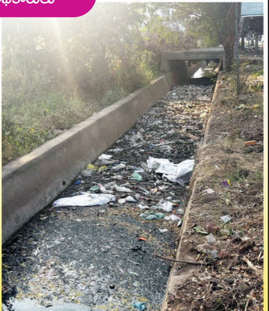
స్థానిక సుల్తానాబాద్ వద్దనున్న అలపాటిగర్ లోని మురుగు కాల్వలో పేరుకుపోయిన వ్యర్థాలు

ముడుపులు అందుకుంటున్నట్లు సమాచారం. ఈ విషయాన్ని కొందరు కార్మికులు ఉన్నతాధికారులు దృష్టికి తీసుకువెళ్లినా ఏమీ చేయలేని పరిస్థితి ఉందని వారు అసహనం వ్యక్తం చేస్తున్నారు. పారిశుధ్య నిర్వహణకు వినియోగించే కాంప్యాక్టర్లు, ట్రాక్టర్లు, పాప్ కార్లు, జేసీబీ వంటి వాటికి సంబంధించి ఆయిల్ పంపిణీ విషయంలో ఎవరికి పోటీ పడుతూ అందినకాడికి వారు దండుకుంటున్నట్లు ఆరోపణలు వస్తున్నాయి. వాహనాలకు కేటాయించే ఆయిల్ ను కొందరు ఇన్ఫ్రాక్టర్లు కోత విధిస్తుండటంతో డ్రైవర్లు అసహనం వ్యక్తం చేస్తున్నారు. ఇందుకు సహకరించని డ్రైవర్లపై కక్ష సాధింపు చర్యలకు పాల్పడుతున్నట్లు తెలుస్తోంది. పారిశుధ్య పనితీరు మెరుగుపర్చేందుకు ప్రభుత్వం సచివాలయ వ్యవస్థను తీసుకువచ్చినా కొందరు ఇన్ఫ్రాక్టర్లు ఒంటెద్దుపోకడతో వారికి సహకరించడం లేదు. దీన్ని అరికట్టడంలో ఉన్నతాధికారులు సఫలీకృతం కాలేకపోతున్నారు వాపోతున్నారు. అవుట్ సోర్సింగ్ కార్మికుల వద్ద నుండి సైతం ఇంచార్జులుగా వ్యవహరిస్తున్న వారు వసూళ్లకు పాల్పడుతున్నారని