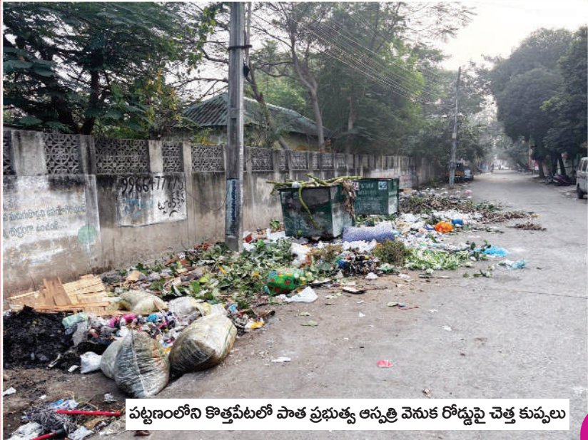
పట్టణంలోని కొత్తపేటలో పాత ప్రభుత్వ ఆస్పత్రి వెనుక రోడ్డుపై చెత్త కుప్పలు

కొనసాగుతున్న శానిటరీ ఇన్ఫ్రాక్టర్ల అవినీతి పరంపర చూసి చూడనట్లు వ్యవహరిస్తున్న ఉన్నతాధికారులు