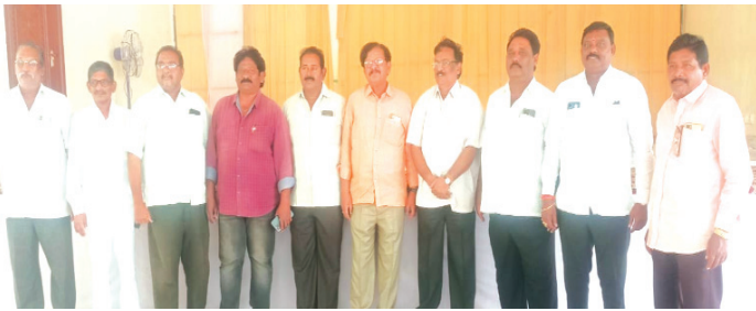
చిలకలూరిపేట, మేజర్ స్వ్యాస్ :