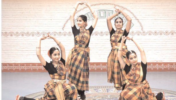
మాదాపూర్, మేజర్ న్యూస్ : మాదాపూర్ శిల్పారామంలో గాంధీ శిల్ప బజార్ మేళా శుక్రవారంతో ముగిసింది. గత పది రోజుల నుండి శిల్పారామంలో