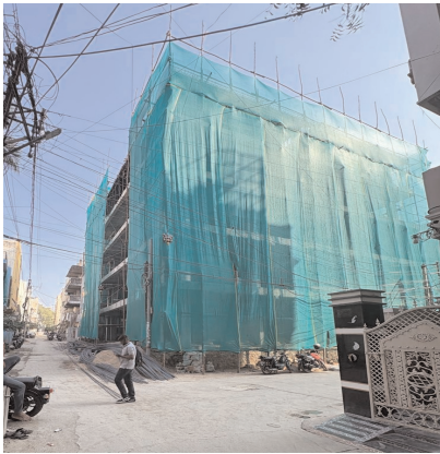
సీతాఫలమండి, మేజర్ న్యూస్: అక్రమ నిర్మాణాలపై కొరడా జారీపించాల్సిన పట్టణ ప్రణాళిక అధికారులు

మామూళ్ల మత్తులో అక్రమ సరదాలకు బాసటగా నిలుస్తున్నారు. అక్రమ నిర్మాణాలకు అడ్డుకట్ట వెయ్యడానికి ప్రభుత్వం ఏ నియమ నిబంధనలు పెట్టినా అచరణలో సాధ్యం కాకుండా పోతుంది. మేడిబావిలో కళ్ళముందే బహుళ అంతస్తులు వెలుస్తున్న ఆ నిర్మాణాన్ని అడ్డుకట్ట వెయ్యడంలో విఫలమయ్యారు. కళ్ళముందే పేకమేడలా బహుళ అంతస్తులు వెలుస్తున్న టౌన్ ప్లానింగ్ అధికారులు తమకేమీ పట్టనట్టు వ్యవహరిస్తున్నారు. స్టాఫ్ కు ఇంత అని రేటు నిర్ణయించి స్వయంగా అధికారులే కింది స్థాయి సిబ్బంది నిర్మాణాలను పర్యవేక్షిస్తున్నారని ఆరోపణలు వినిపిస్తున్నాయి. అక్రమ నిర్మాణాలు జరుగుతున్న ప్రాంతంలో ఇరుగు పొరుగు వారు అధికారులకు ఫిర్యాదు చేస్తే ముందుగానే ఆయా భవన నిర్మాణదారులతో కుమ్మక్కైన అధికారులు ఏ విధంగా అతిక్రమించాలో