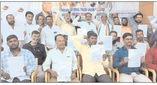
హైదరాబాద్ / మేజర్ న్యూస్ : ఆర్థికంగా అన్ని రంగాలలో వెనుకబడిన రవాణా రంగ కార్మికులకు ప్రభుత్వం ప్రత్యేక సంక్షేమ బోర్డును ఏర్పాటు చేయాలని, తెలంగాణ రాష్ట్ర, ఆటో డ్రైవర్, వర్కర్స్ యూనియన్(ఐఎస్యూసి) గ్రేటర్