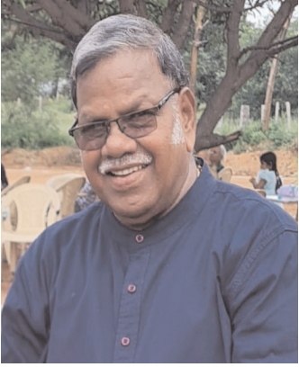
రంలో ప్రారంభించబడిన సంస్కార భారతి అంచెలంచెలుగా దేశ వ్యాప్తంగా 12