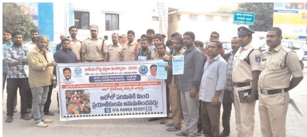
పాటించాలని సూచించారు. సెల్ ఫోన్ మాట్లాడుతూ డ్రైవింగ్ చేసిన, తాగి వాహనం నడిపిన చర్యలు తప్పవని హెచ్చరించారు.