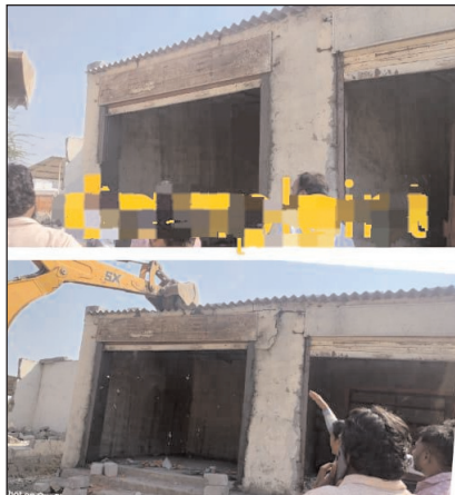
జవహర్ నగర్, మేజర్ న్యూస్; ప్రభుత్వ భూముల్లో అక్రమ నిర్మాణాలు కూల్చిన చోట నిర్మిస్తే క్రిమినల్ కేసులు నమోదు చేస్తామని కాప్ర మండల

● సూచికలు తొలగిస్తే క్రిమినల్ కేసులు నమోదు ● అధికారులపై దాడులకు పాల్పడితే జైలుకు పంపుతాం