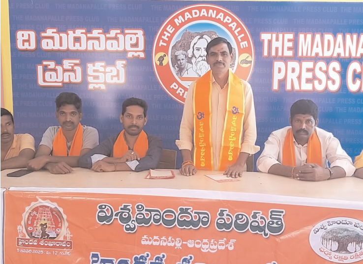
మదనపల్లె టౌన్,మేజర్ న్యూస్ : దేవాలయాల రక్షణ కోసం ఈ నెల 5వ తేదీన జరిగే హైందవ శంఖారావాన్ని జయప్రదం చేయాలని