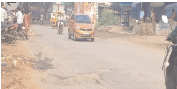
చిన్న గుంతలుగా ఏర్పడి, పెద్ద పెద్ద గుంతలుగా తయారైన నాయిని ప్రయాణికులు వాపోతున్నారు.

రైల్వే కోడూరు (రూరల్) మేజర్ న్యూస్ కడప చెన్నై రహదారిలో ఓబలవారిపల్లె రోడ్డులో గుంతలు పూడ్చి బాగు చేస్తారా, గుంతలలో పడి మరణించిన తరువాత గుంతలలోకి పంపుతారా అని ప్రయాణికులు ఆవేదన చెందుతున్నారు. కడప చెన్నై జాతీయ రహదారిలో రాజంపేట నుంచి రోడ్డు మార్గంలో అలాగే రైల్వే కోడూరు మండలం శెట్టి గుంట నుండి రేణిగుంట వరకు గుంతలు పూడ్చేందుకు ఎవరూ ముందుకు రావడం లేదని ప్రయాణికులు, ఆవేదనకు గురై, ప్రమాదాలుకు గురౌతున్నారు. తొలుత చిన్న