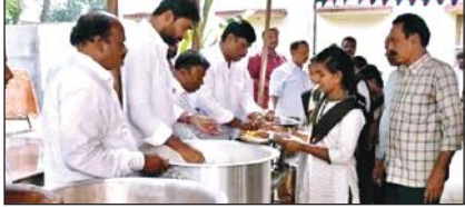
అన్నారు. ప్రతి విద్యార్థి చదువుకొనే కళాశాల విద్యార్థులకు ఈ పథకం ఎంతో సద్వినియోగం చేసుకోవాలని అన్నారు. రాష్ట్ర విద్యాశాఖ మంత్రి విజన్ గలిగిన నాయకులని ప్రతి విద్యార్థిని