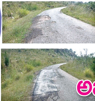
• BEFO RE