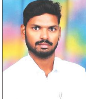
తిరుమల వైకుంఠ ద్వార దర్శనం టికెట్ల విడుదల నేపథ్యంలో తిరుపతిలోని విష్ణు నివాసం దగ్గర జరిగిన తొక్కిసలాటలో భక్తులు మృతి చెందడం మమ్మల్ని తీవ్ర మనోవేదనకు గురిచేసింది. టీడీపీ విజి తెన్స్, పోలీసుల వైఫల్యం పై విచారణ చేయాలి. మృతుల కుటుంబాలకు టీడీపీ లో శాశ్వత ఉద్యోగం కల్పించాలి. గాయ పడిన వారికి మెరుగైన వైద్యం కల్పించి, ఆర్థిక సహాయం చేయాలి. ఇటువంటి అవాంఛనీయ ఘటనలకు తావీయకుండా టీడీపీ మరింత పకడ్బందీగా ఏర్పాట్లు చేయాలి. మృతి చెందిన భక్తుల కుటుంబాలకు ప్రభుత్వం, టీడీపీ అండగా ఉండాలి. ప్రజాసంకల్ప వేదిక రాష్ట్రకమిటీ అవినీతి నిరోధక విభాగం రాష్ట్ర వర్సింగ్ ప్రెసిడెంటుల షేక్. ఖాజామోదీన్ తెలిపారు.

పులివెందుల మేజర్ న్యూస్ : తిరుమల వైకుంఠ ద్వార దర్శనం టికెట్ల విడుదల నేపథ్యంలో తిరుపతిలోని విష్ణు నివాసం దగ్గర జరిగిన తొక్కిసలాటలో భక్తులు మృతి చెందడం మమ్మల్ని తీవ్ర మనోవేదనకు గురిచేసింది. టీడీపీ విజి తెన్స్, పోలీసుల వైఫల్యం పై విచారణ చేయాలి. మృతుల కుటుంబాలకు టీడీపీ లో శాశ్వత ఉద్యోగం కల్పించాలి. గాయ పడిన వారికి మెరుగైన వైద్యం కల్పించి, ఆర్థిక సహాయం చేయాలి. ఇటువంటి అవాంఛనీయ ఘటనలకు తావీయకుండా టీడీపీ మరింత పకడ్బందీగా ఏర్పాట్లు చేయాలి. మృతి చెందిన భక్తుల కుటుంబాలకు ప్రభుత్వం, టీడీపీ అండగా ఉండాలి. ప్రజాసంకల్ప వేదిక రాష్ట్రకమిటీ అవినీతి నిరోధక విభాగం రాష్ట్ర వర్సింగ్ ప్రెసిడెంటుల షేక్. ఖాజామోదీన్ తెలిపారు.