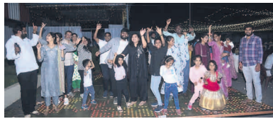
కలు జరుపుకోవాలని పోలీసు అధికారులు సూచించారు.

డిసెంబర్ 31 వేడుకలలో ఎలాంటి అవాంఛనీయ సంఘటనలు జరగకుండా, వేడుకలు శుభ్రమించుకుండా పోలీసులు పకడ్బందీ చర్యలు చేపట్టారు. మద్యం తాగి వాహనాలు నడిపే వారి కోసం స్పెషల్ డ్రైవ్ నిర్వహించారు. రాత్రి 10 గంటల నుండి ఉదయం 5 గంటల వరకు ప్రధాన కూడలిలతోపాటు వీధులలో గస్తీ నిర్వహించారు. డిజైన్ సౌండ్ పెట్టిన, భారీ శబ్దాలతో టపాసులు కాల్చిన కఠిన చర్యలు తీసుకుంటామని ముందే హెచ్చరించారు. పోలీసుల ముందస్తు హెచ్చరికలతో యువత జాగ్రత్తలు పాటించి ఎలాంటి అవాంఛనీయ ఘటనలకు తావు లేకుండా ప్రశాంత వాతావరణంలో న్యూ ఇయర్ వేడుకలు జరిగాయి. ప్రజలంతా తమ ఇంట్లోనే కుటుంబ సభ్యులతో ఆనందోత్సవాల మధ్య నూతన సంవత్సర వేడు