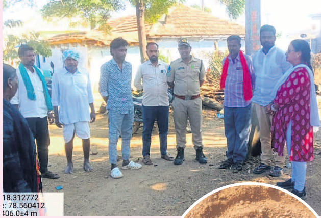
18.312772 : 78.560412 106.0±4 m