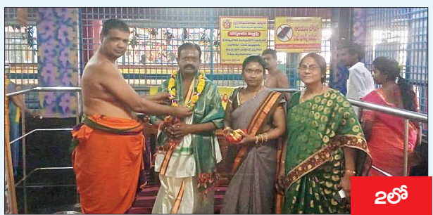
పెద్దమ్మతల్లిని దర్శించుకున్న జిల్లా జాయింట్ కలెక్టర్