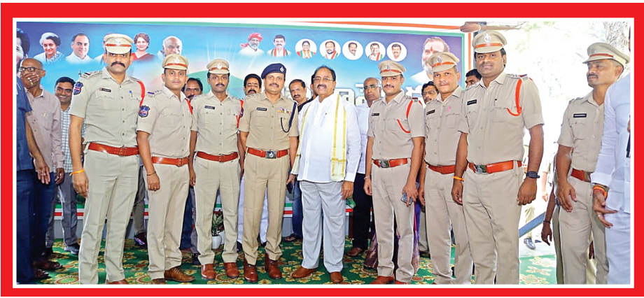
మంత్రి తుమ్మల నాగేశ్వరరావును మర్యాదపూర్వకంగా కలిసి నూతన గుండ్ల తోటలు తెలిపిన ఖమ్మం పోలీస్ అధికారులు