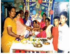
భారీ సంఖ్యలో పాల్గొన్న భక్తులు

చంద్రుగొండ, సూర్య (మేజర్ న్యూస్)- శ్రీ రుక్మిణి సత్యభామ సమేత వేణుగోపాలస్వామి ఆలయంలో శ్రీ రంగనాయకుల గోదాదేవి కళ్యాణం కన్నులు పండుగగా ఘనంగా నిర్వహించారు. మండల కేంద్రము లోని వేణుగోపాల స్వామి ఆలయంలో ధనుర్మాసోత్సవాల్లో భాగంగా సోమవారం మధ్యాహ్నం ఉపమాకలో గోదాదేవి, శ్రీరంగనాథుడి కల్యాణోత్సవాన్ని ఆలయ పురోహితులు ఘనంగా నిర్వహించారు. ముందుగా స్వామివారి మూలవిరాట్ కు