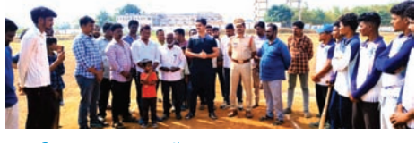
కిన్నెరసానిలో ఘనంగా ప్రారంభమైన కామరం భీమ్ క్రికెట్ టోర్నమెంట్

చుంచుపల్లి, సూర్య (మేజర్ న్యూస్)- సంక్రాంతి పండగ వచ్చిందంటే చాలు చిన్న పెద్ద తేడా లేకుండా యువకులు పతంగులు ఎగిరిస్తుంటారు. కొందరి సరదా మరికొందరికి గాయాలు చేస్తున్నాయి. ఇందుకు ప్రధాన కారణం పతంగులకు వాడుతున్న చైనా మాంజా ప్రధాన కారణంగా చెప్పవచ్చు పతంగులు ఎగురవేసే సమయంలో చైనా మాంజాను అధికారులు నిషేధించారు. అయితే అనేక పట్టించుకోని కొందరు చైనా మాంజాను వాడుతూ పతంగులు ఎరుగువేస్తున్నారు. భద్రాచలం కొత్తగూడెం జిల్లా కొత్తగూడెం నియోజకవర్గం కొత్తగూడెం పట్టణం పరిధిలో సోమవారం 11వార్డు లో చిట్టి రామవరం తండాలో కొందరు యువకులు గాలిపతంగులు ఎగురవేస్తున్నారు. ఆ సయమంలో వన్నుందాస్ గడ్డ నుంచి చిట్టిరామవరం తండాకు ఇద్దరు యువకులు కలిసి బైక్పై వెళ్తున్న సమయంలో చైనా మాంజా దారం కాలు తుంటికి తగలడంతో ఒక యువకుడికి తీవ్రంగా గాయాలయ్యాయి.