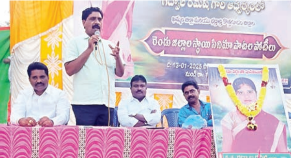
వైరాసూర్యమేజర్ స్పాన్సర్ -

-ప్రారంభించిన భూక్యా వీరభద్రం, -మనువాద భావజాలాన్ని తిప్పి కొట్టాలి -ప్రజా సంస్కృతి అభ్యుదయ కళలను కాపాడుకోవాలి.....భూక్యా వీరభద్రం