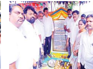
సూర్య బ్యూరో/ తిరుమలాయపాలెం మేజర్ న్యూస్

గ్రామసభల్లో చదివే జాబితా తుది జాబితా కాదు... ఈ నెల 26 నుంచి అమలు కాబోతున్న నాలుగు పథకాల జాబితాలో పేర్లు రాలేదని ఎవరూ ఆందోళన చెందాల్సిన పనిలేదని జాబితాలో పేరు ఉంటే ఉన్నట్లు.... లేకపోతే రానట్లు కాదని తెలంగాణ రెవెన్యూ, గృహ నిర్మాణం, సమాచార శాఖల మంత్రి పొంగులేటి శ్రీనివాసరెడ్డి స్పష్టం చేశారు. తిరుమలాయపాలెం మండలంలో కేశవాపురం, తిప్పారెడ్డి గూడెం, జల్లెపల్లి, హైదరసాయిపేట, పడమటి తండా, జోగులపాడు, చంద్రు తండా, మహబూబ్ నగర్ తదితర గ్రామాల్లో పర్యటించి పలు అభివృద్ధి పనులకు శంకుస్థాపన చేశారు.