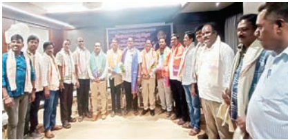
ఖమ్మం టౌన్, సూర్య న్యూస్: