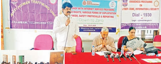
అవగాహన కల్పించాలని కోరారు. తల్లిదండ్రులు లేని సమయంలో బాలలు అంతర్జాలాన్ని వినియోగించాల్సిన వస్తే అనవసరమైన కంటెంట్ వారు చూడకుండా