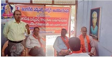
కోల్ ఇండియా, సింగరేణి యాజమాన్యాలను ఒప్పించాం