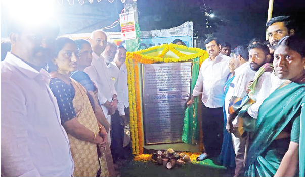
ఖమ్మం (సూర్య బ్యూరో):

-ఖమ్మం రూరల్ మండలంలో పర్యటించి పలు రోడ్డు నిర్మాణ పనులకు శంకుస్థాపనలు చేసిన మంత్రి పొంగులేటి