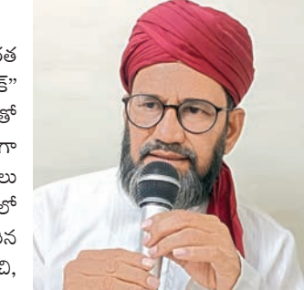
ప్రత్యేక కార్యదర్శి, డైరెక్టర్ మైనారిటీ కార్యదర్శులకు లేఖలు రాశామన్నారు.