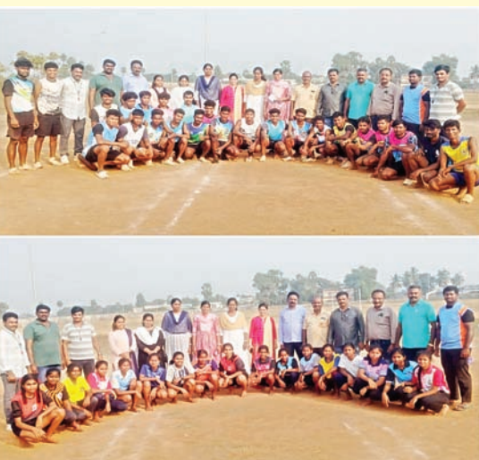
కల్లూరు జనవరి04(సూర్య న్యూస్):