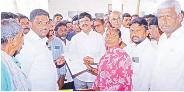
సీఎం సహాయనిధి పేదలకు వరం

మండలంలోని గ్రామాల సమగ్ర అభివృద్ధి లక్ష్యంగా ప్రజా ప్రభుత్వం పని చేస్తుందని మంత్రి పొంగులేటి శ్రీనివాస్ రెడ్డి అన్నారు. శనివారం మండలంలోని పలు గ్రామాల్లో అభివృద్ధి పనులకు శంకుస్థాపన చేశారు.లోక్యాతండా గ్రామంలో రూ. 20 లక్షలతో సీసీ రోడ్ల నిర్మాణ పనులకు శంకుస్థాపన చేశారు.కోక్యాతండాలో రూ. 15లక్షలతో సీసీ రోడ్డు నిర్మాణ పనులకు శంకుస్థాపన చేశారు. లింగారాంతండాలో రూ. 20లక్షలతో సీసీ రోడ్డు పనులకు శంకుస్థాపన చేశారు... ఈ సందర్భంగా మంత్రి పొంగులేటి మాట్లాడుతూ సీఎం రేవంత్ రెడ్డి నాయకత్వంలోని ప్రజా పాలనలో అభివృద్ధి, సంక్షేమ ఫలాలు అర్జున ప్రతి ఒక్క పేద ప్రజలకు అందేలా చూస్తానని హామీ ఇచ్చారు. ప్రజా ప్రతినిధులు అధికారులు సమన్వయంతో ప్రజల భాగస్వామ్యంతో ప్రజా ప్రభుత్వం గ్రామాలను అభివృద్ధి చేస్తుందని తెలిపారు. మహిళల సంక్షేమానికి ప్రభుత్వం కృషి చేస్తుందని వారి పేర్కొన్నారు. గుత్తేదారులు నాణ్యతతో కూడిన పనులను త్వరితగతిన పూర్తి చేయాలని నాణ్యతలో రాజీ పడే ప్రసక్తే లేదని వారన్నారు. అనంతరం ధర్మ తండా శ్రీలక్ష్మి తిరుపతమ్మ తల్లి మాలదారులు ఏర్పాటు చేసిన మహా అన్నదాన కార్యక్రమంలో పాల్గొన్నారు.