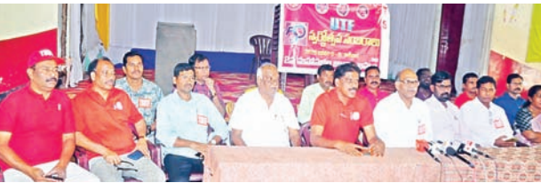
ఖమ్మం సూర్య టౌన్ స్కూల్స్