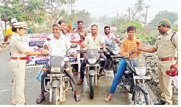
సాహెల్, సిబ్బంది తదితరులు పాల్గొన్నారు.

అందించి రోడ్డు భద్రత అందరి బాధ్యత అని ప్రతిజ్ఞ చేయించారు. రోడ్డు ప్రమాదాల్లో హెల్మెట్ ధరించకపోవడంతో అధిక శాతం మరణాలు సంభవిస్తున్నాయని హెచ్చరించారు. రోడ్డు నిబంధనలు పాటించకుండా అతివేగంగా వాహనాలు నడపడం ద్వారా రోడ్డు ప్రమాదాలు జరుగుతున్నాయని రోడ్డు ప్రమాదాలు నివారించే బాధ్యత మనందరిపై ఉందని ముఖ్యంగా యువత రోడ్డు నియమాలను అవగాహన కలిగి ఉండాలని అన్నారు. తద్వారా తమ ప్రాణాలను, ఎదుటివారి ప్రాణాలను కాపాడిన వారమవుతామని సూచించారు. ఈ కార్యక్రమంలో కానిస్టేబుల్స్ సిహెచ్. వెంకటేశ్వరరావు, వి నిచ్చల, టీబీపి