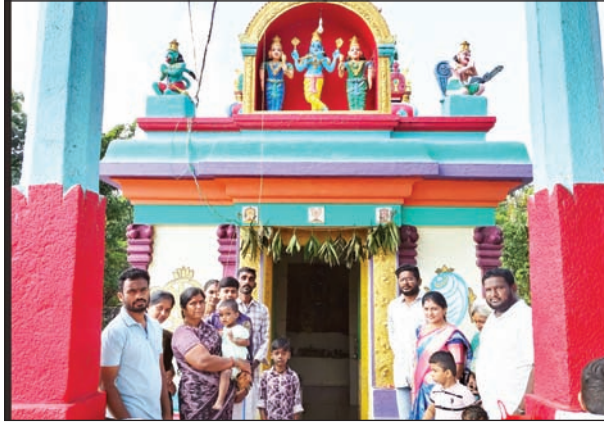
శ్రీ వేణు గోపాలస్వామి వారి దేవాలయం