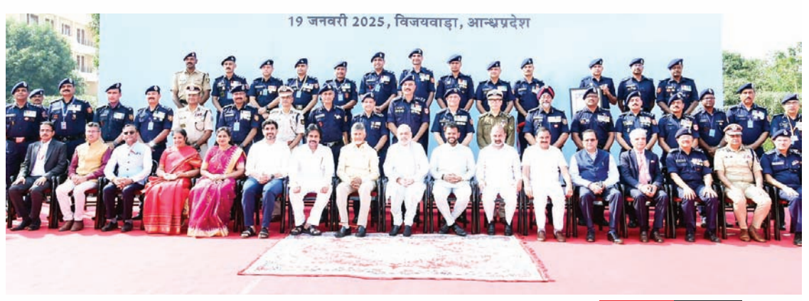
(గన్నవరం, జనవరి 19, మేజర్ స్కూల్స్)