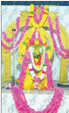
శ్రీ పర్వత వర్ధనీ దేవి

విగ్రహాలు పునః ప్రతిష్ఠ చేశారు. పెద్ద ఎత్తున జరిగిన కార్యక్రమాలకు ఎస్.ఎస్.ఆర్. హాజరైనారు.