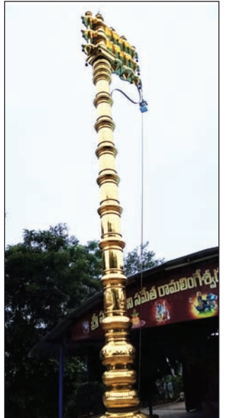
రీవీగా పున్న నూతన ధ్వజస్తంభం