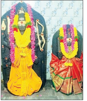
శ్రీ భద్రకాళీ సమేత శ్రీ వీరభద్ర స్వామి