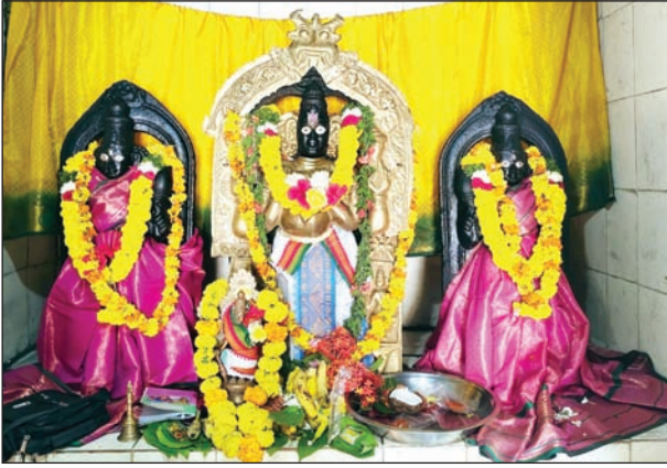
శ్రీ రుక్మిణీ సత్యభామా సమేత శ్రీ వేణుగోపాల స్వామి వారు