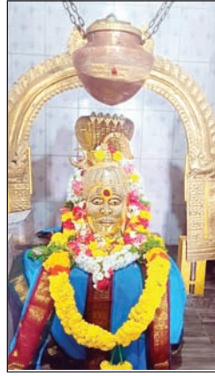
శ్రీ రామ లింగేశ్వర స్వామి వారు