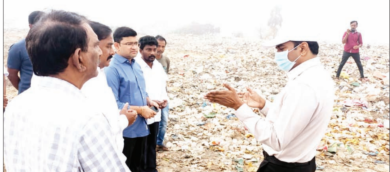
పదార్థాలను విడిచి వేయడం వలన వీరవరితమైన దుర్గంధంతో పాటు అంటు రోగాలు ఏర్పాడుతున్నాయన్నారు. జగ్గయ్యపేట పట్టణ పరిధిలో విలియం పేట సమీపంలో వ్యర్థాలను విడిచిన డంపింగ్ యార్డ్ వలన ప్రజలు అనేక ఇబ్బందులు పడుతున్నట్లు స్థానిక శాసనసభ్యులు తన దృష్టికి మిగతా 2లో