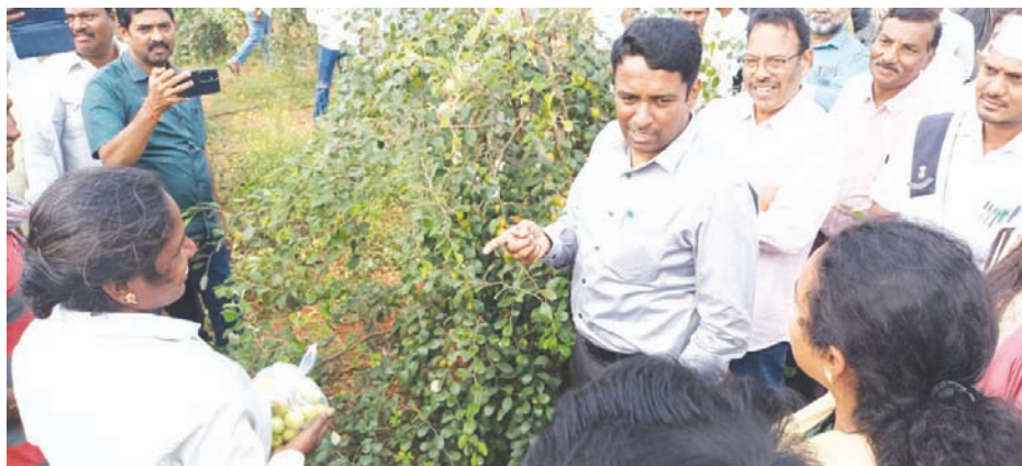
సమన్వయంతో పనిచేసి రైతులు తక్కువ పెట్టుబడితో సూచించారు. తోటల్లో కూరగాయలు, చిరుధాన్యాలను అధిక లాభాలు సాధించేలా చేయూతనందించాలని అంతర పంటగా వేసుకునేలా, కలుపు సమన్వయ లేకుండా