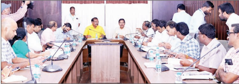
గత ప్రభుత్వ నిర్ణయంతో నగర ప్రజలు సమీక్షించారు