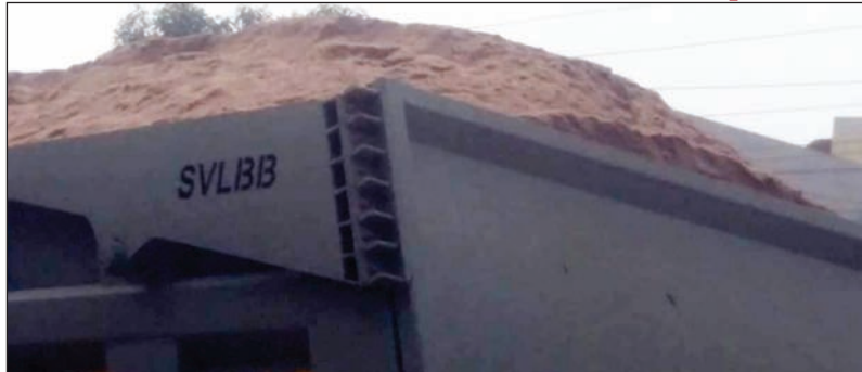
భద్రతా పరమాణాలు పాటించకుండా అధికలోడుతో ఇసుక టిప్పర్

కంచికపర్ల జనపరి 3 మేజర్ స్టూన్స్ : అధికలోడు, అక్రమ ఇసుక, భద్రతా ప్రమాణాలు పాటించకుండా రవాణా జరుగుతున్న అధికారులు ఏమి పట్ట నట్లు వ్యవహరించడం పట్ల పలు విమర్శలు వస్తున్నాయి. కనీసం పట్టా కూడా లేకుండా నిండుగా ఇసుకలోడుతో ప్రధాన రహదారుల్లో టిప్పర్లు పాల్గొనే వస్తున్నాయి. దీనిపట్ల ప్రధాన రహదారిలో తిరిగే ద్వీచక్ర వాహన