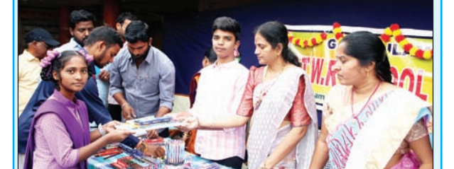
పుస్తకాలు పెన్నులు అందజేసిన ఎమ్మెల్యే కుమారుడు