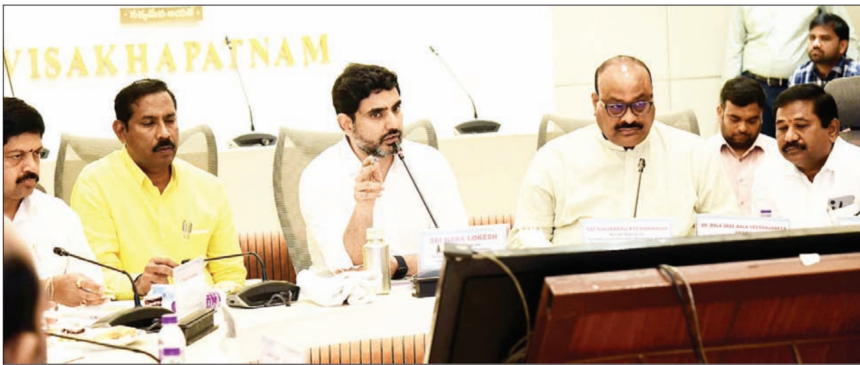
ప్రధాని పర్యటన రాష్ట్రానికి ఎంతో కీలకం

ప్రధాన మంత్రి పర్యటన రాష్ట్రానికి ఎంతో కీలకం అని, రాష్ట్ర భవిష్యత్ ఈ పర్యటనపై ఆధారపడి ఉందని ఈ సందర్భంగా మంత్రి నారా లోకేశ్ వ్యాఖ్యానించారు. ఆంధ్ర రాష్ట్ర అభివృద్ధికి మోడీ ఎంతో మద్దతుగా నిలుస్తున్నారని, ఏ రాష్ట్రానికి కేటాయించిన ప్రాజెక్టులను, నిధులను ఏపీకి కేటాయించారని మంత్రి తెలిపారు. రాష్ట్రాన్ని ఫాస్ట్ ట్రాక్ లో పెట్టేందుకు కేంద్ర మద్దతు చాలా అవసరం. అభివృద్ధి వికేంద్రీకరణ ఎన్డీయే నినాదం. ఇదేదో కేవలం ఉత్తరాంధ్రకు సంబంధించిన పర్యటన కాదు.. మొత్తం ఆంధ్ర రాష్ట్ర భవిష్యత్ కు సంబంధించినది. మనం కూడా సింగిల్ వెంటడాతో బూత్ స్థాయిలో మానిటరింగ్ చేసి ప్రధాని పర్యటనను విజయవంతం చేయాలి. అందుకు తగ్గట్టుగా ప్రధాని రోడ్ షో, బహిరంగ సభకు ఘనంగా ఏర్పాట్లు చేయాలి. గతంలో విజయవాడలో జరిగిన ప్రధాని రోడ్ షో కంటే మిన్నగా జరగాలని అధికారులను ఆదేశించారు. ఇప్పటికీ విజయవాడ రోడ్ షో, చిలకలూరిపేటలో జరిగిన బహిరంగ సభల గురించి ప్రధాని ప్రస్తావిస్తుంటారని ఈ సందర్భంగా మంత్రి నారా లోకేశ్ గుర్తుచేశారు.