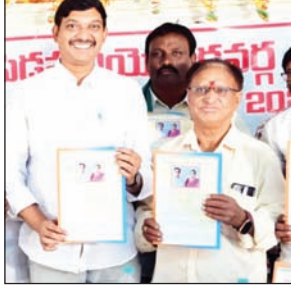
ఎస్.ఎస్.ఆర్. బయోగ్రఫీ ఆవిష్కరించిన పెడన శాసన సభ్యులు కాగిత