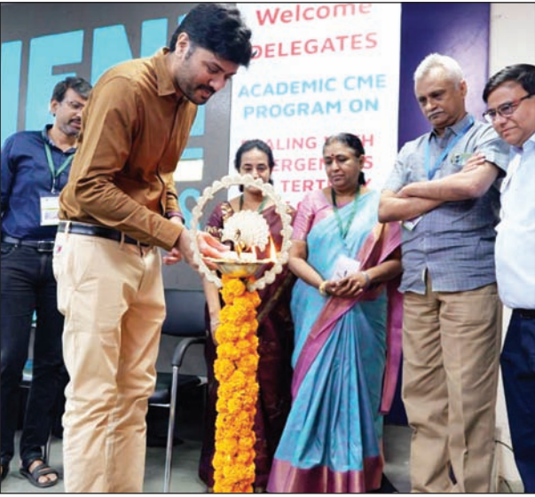
అత్యవసర సమయంలో ప్రతి క్షణం కీలకమే