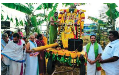
మహానంది క్షేత్రంలో పారువేట ఉత్సవం

మహానంది, మేజర్ న్యూస్ : మహానంది పుణ్య క్షేత్రంలో సంక్రాంతి పర్వదినాన్ని పురస్కరించుకొని పారువేట ఉత్సవాలను వైభవంగా నిర్వహించారు. మంగళవారం సంక్రాంతి పర్వదినాన్ని పురస్కరించుకొని శ్రీ సీతారామ లక్ష్మణ ఆంజనేయ స్వామి వార్లకు తిరుమంజన సేవా కార్యక్రమాలను నిర్వహించారు. బుధవారం పారువేట ఉత్సవాలను నిర్వహించారు. ముందుగా రైతు సంక్షేమం కోరుతూ మహానంది క్షేత్రంలోని గోపాలలో గో పూజా