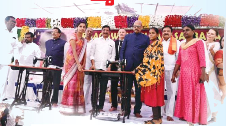
నిరుపేద కుటుంబాలకు చేదోడుగా కుట్టు మిషన్లు అందిస్తున్న దృశ్యం