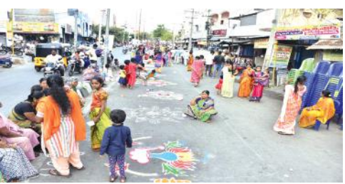
ముగ్గుల పోటీలు నిర్వహిస్తున్న దృశ్యం