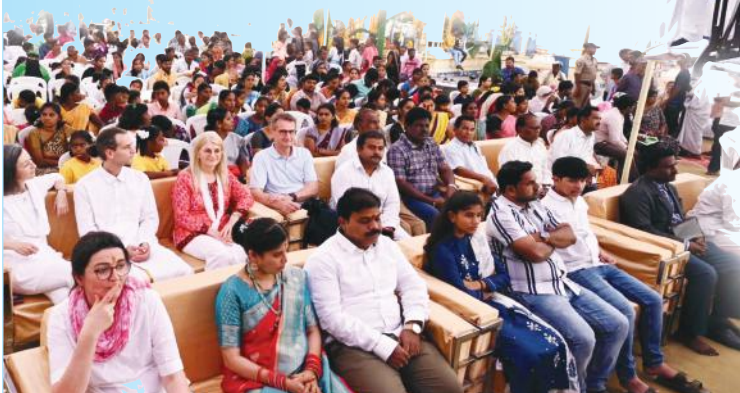
కార్యక్రమానికి హాజరైన విదేశీ, స్వదేశీ భక్తులు