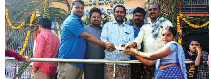
ముగ్గుల పోటీల్లో పాల్గొన్న మహిళలు