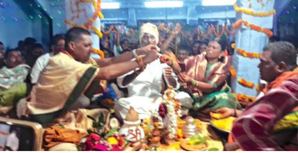
కళ్యాణం జరిపిస్తున్న పురోహితులు

కొత్తపల్లి, మేజర్ న్యూస్ : మండల కేంద్రమైన కొత్తపల్లిలో తాండవ మల్లేశ్వర స్వామి కళ్యాణం మంగళవారం రాత్రి సమయంలో భక్తుల మధ్య కన్నుల పండవగా జరిగింది. ఉదయం స్వామివారికి బిందె సేవ, రుద్రాభిషేకం, అన్నవారికి కుంకుమార్చన, ప్రత్యేక పూజా కార్యక్రమాలు నిర్వహించారు. రాత్రి సమయంలో పార్వతీ దేవి, తాండవ మల్లేశ్వర స్వామి ఉత్సవ విగ్రహాలకు ఆలయ పురోహితులు కళ్యాణంను ఘనంగా నిర్వహించారు. అధిక సంఖ్యలో భక్తులు పాల్గొని ఈ కళ్యాణంను తిలకించారు. అనంతరం బుధవారం ఉదయం స్వామివారికి ప్రత్యేక పూజా కార్యక్రమాలు నిర్వహించారు. బుధవారం రాత్రి వేళల్లో రథంపైన స్వామివార్లను