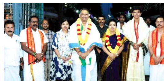
ఆలయ రాజగోపురం వద్ద స్వాగతం పలుకుతున్న దృశ్యం