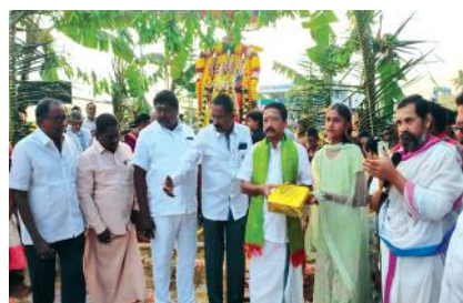
గెలుపొందిన వారికి ప్రోత్సాహక బహుమతి