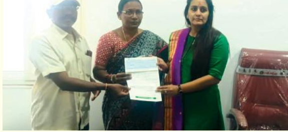
సీఎం రిలీఫ్ ఫండ్ చెక్కు అందజేస్తున్న ఎంపీ బైరెడ్డి శబరి

కర్నూలు, మేజర్ న్యూస్ ప్రతినిధి : పేద ప్రజల సంక్షేమం కోసం ముఖ్యమంత్రి సహాయ నిధి ఎంతగానో తోడ్పడుతుందని నంద్యాల ఎంపీ బైరెడ్డి శబరి అన్నారు. బుధవారం కల్లూరులోని ఎంపీ నివాసంలో సీఎం సహాయ నిధి చెక్కులను బాధితులకు అందజేశారు. ఈ సందర్భంగా ఎంపీ బైరెడ్డి శబరి మాట్లాడుతూ ఎంతోమంది నిరుపేదలు ఆసుపత్రి పాలై ఆర్థికంగా ఎంతో ఇబ్బంది పడుతున్న వారికి సీఎం రిలీఫ్ ఫండ్ ఎంతగానో ఉపయోగపడుతుందన్నారు. ముఖ్యమంత్రి నారా చంద్రబాబునాయుడు ఏ కుటుంబంలో కష్టం ఎదురైతే ఆ కుటుంబానికి పెద్ద కొడుకుగా ఆదుకుంటానని మాట ఇచ్చి ఆ మాటను నిలబెట్టుకోవడం చాలా సంతోషకరమన్నారు. అనంతరం బాధితులకు సీఎం రిలీఫ్ ఫండ్ చెక్కులను అందజేశారు.