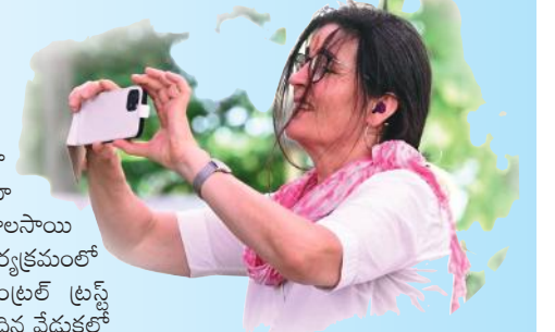
బాలసాయి జన్మదిన వేడుకలను కెమెరాలలో బంధిస్తున్న విదేశీ వనిత