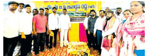
భూమి పూజ నిర్వహిస్తున్న దృశ్యం

- ఆస్థానం నందు డ్రైనేజీ నిర్మాణ పనులు పరిశీలన