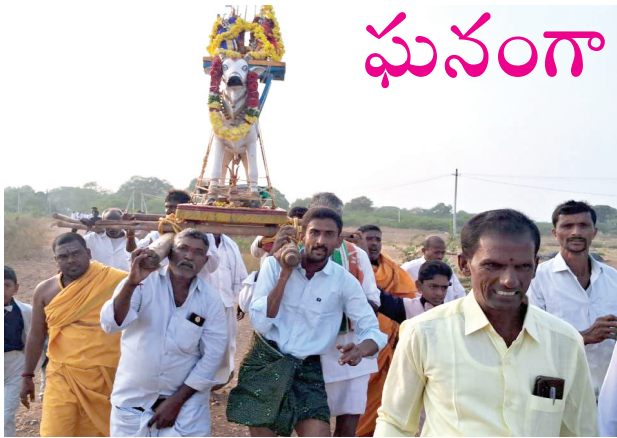
పారువేట కార్యక్రమంలో పాల్గొన్న భక్తులు