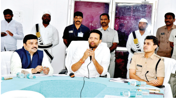
మాట్లాడుతున్న మంత్రి టీ.జి.భరత్