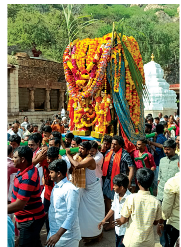
యాగంటి చేరుకున్న ఉమామహేశ్వరులు

బనగానపల్లెమేజర్, న్యూస్ : ఎర్రమల కొండల్లో వెలిసిన యాగంటి శ్రీ ఉమామహేశ్వరస్వామి సంక్రాంతి పర్యటనం సందర్భంగా కొండపై నుంచి పక్కటిలో బయలుదేరి పాతపాడు, మీరాపురం, యాగంటిపల్లె, మాదానుపల్లె గ్రామాలలో పావచేత కార్యక్రమాన్ని ముగించు కొని గురువారంనాడు యాగంటి క్షేత్రానికి చేరుకున్నారు. గ్రామాలకు ఉమామహేశ్వరులు పల్లకిలో రావడంతో ఆయనకు గ్రామాల ప్రజలు భక్తి శ్రద్ధలతో పల్లకిని మోస్తూ నందికోక ఉత్సవం చేస్తూ భక్తిశ్రద్ధలతో స్వామి వారి ఉత్సవ విగ్రహాలను దర్శించుకొని తమ మొక్కులు చెల్లించుకున్నారు.