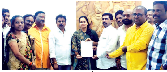
వినతిపత్రం అందజేస్తున్న దృశ్యం