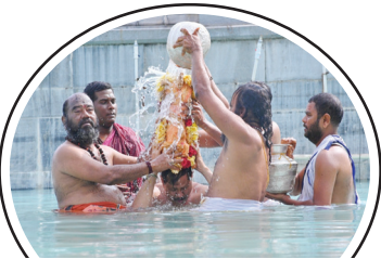
చందీశ్వరస్వామికి పుష్కరిణిలో శాస్త్రోక్తంగా అపబ్ధసానం చేయిస్తున్న ధృత్యం