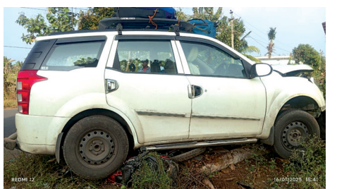
మోటార్ సైకిల్ ను ఢీకొన్న కారు

మహానంది, మేజర్ న్యూస్ : మహానంది మండలంలోని అల్లినగరం గ్రామం వద్ద భక్తులకు పెను ప్రమాదం తప్పింది. గురువారం హనుమకొండకు చెందిన భక్తులు దారిలో పుణ్య క్షేత్రాలను దర్శించుకుంటూ అహోబిలం నుంచి మహానంది క్షేత్రానికి వస్తున్నారు. మార్గ మధ్యంలో అల్లినగరం వద్ద