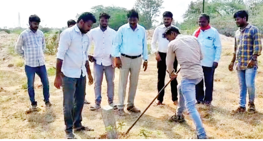
చెరువులో పాతిన రాళ్లను తొలగిస్తున్న అధికారులు

ఇరిగేషన్ అధికారుల దృష్టికి తీసుకెళ్లిన సిపిఎం నాయకులు.. చెరువులో పాతిన రాళ్లను తొలగించిన అధికారులు..