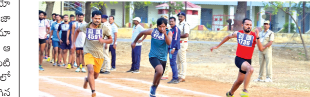
పరుగు పందెంలో పాల్గొన్న అభ్యర్థులు