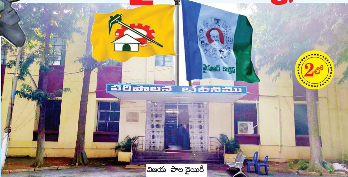
విజయ పాల డైరీ