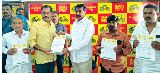
చెక్కులు అందజేస్తున్న దృశ్యం