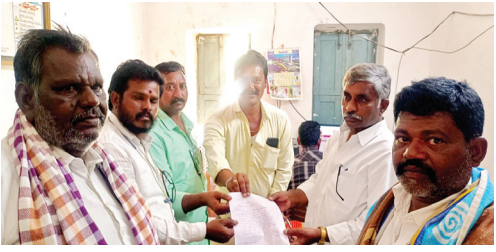
తహశీల్దార్ కు వినతి పత్రం అందిస్తున్న మారందొడ్డి గ్రామస్తులు