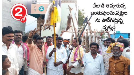
వేచాడి తెచ్చుకున్న జంతువులను, పక్షులను ఊరేగిస్తున్న ధృత్యం