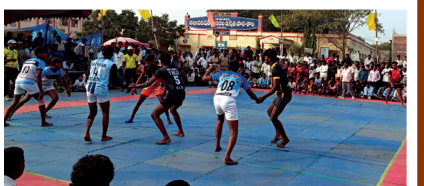
కబడ్డీ ఆడుతున్న దృశ్యం