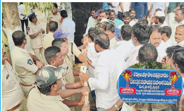
కార్యాలయం వద్ద ఉద్రిక్తత దృశ్యం