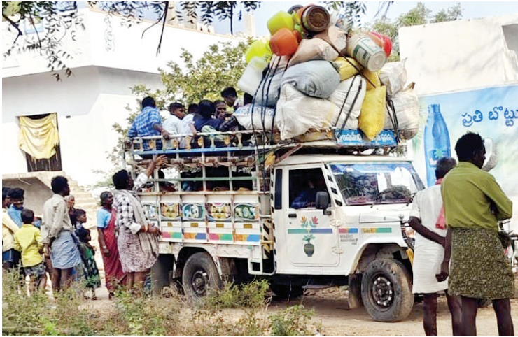
అగసనూరులో టెంపులో బయలుదేరుతున్న వలస కూలీలు