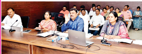
వీడియో కాన్ఫరెన్స్ నిర్వహిస్తున్న దృశ్యం