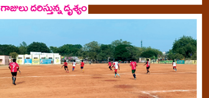
ఫుట్ బాల్ ఆడుతున్న దృశ్యం