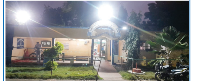
చాగలమర్తి పోలీస్ స్టేషన్ దృశ్యం